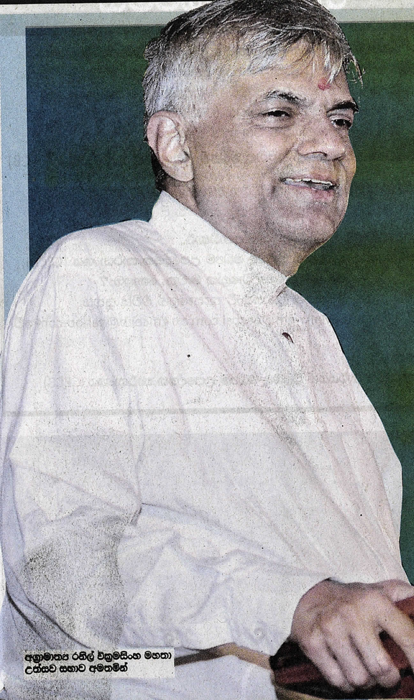
අගමාත්‍ය රනිල් වික්‍රමසිංහ මහතා උරුමය සභාව අමතමින්