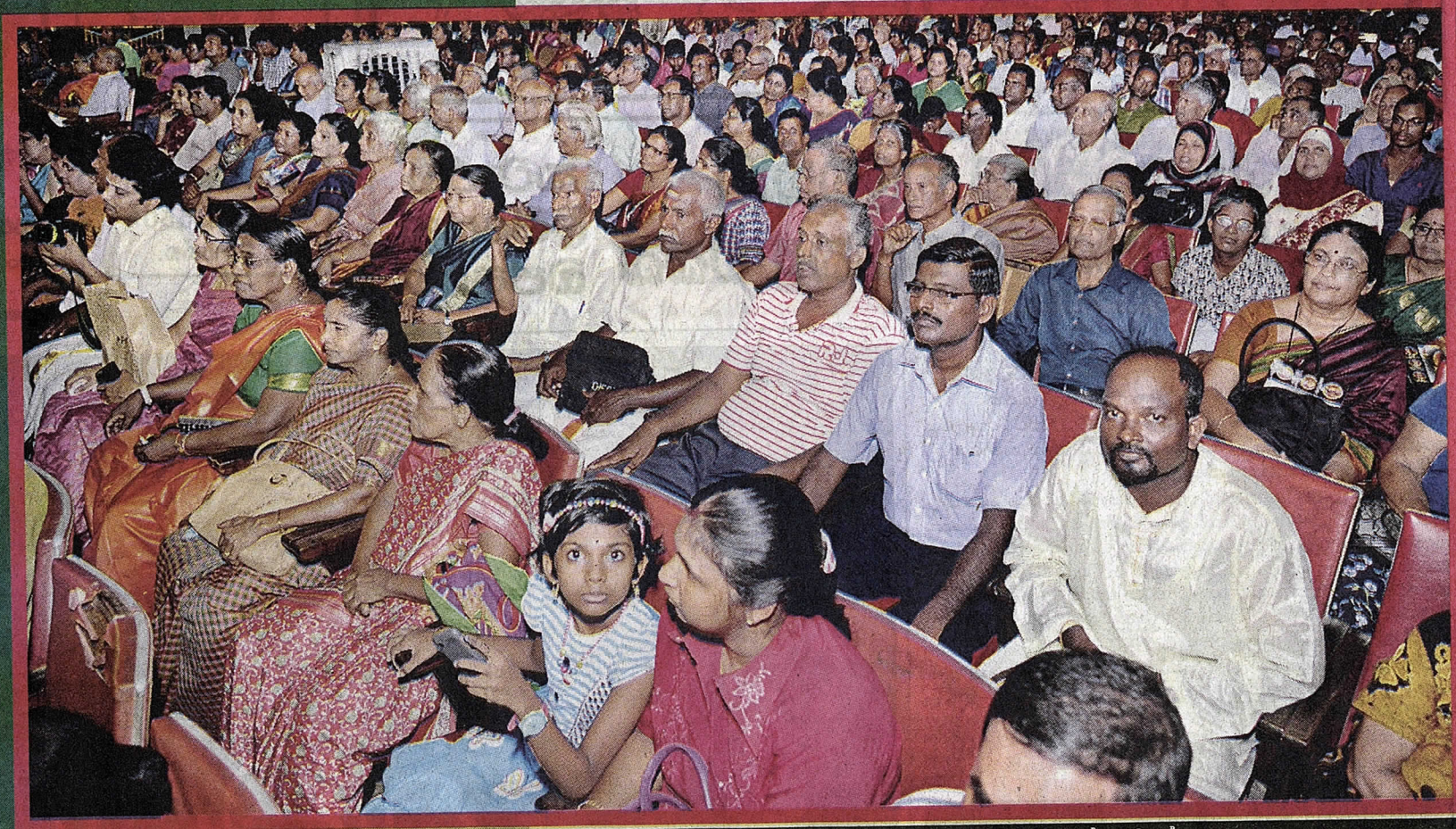
උත්සවයට සහභාගි වූ පිරිසෙන් කොටසක්