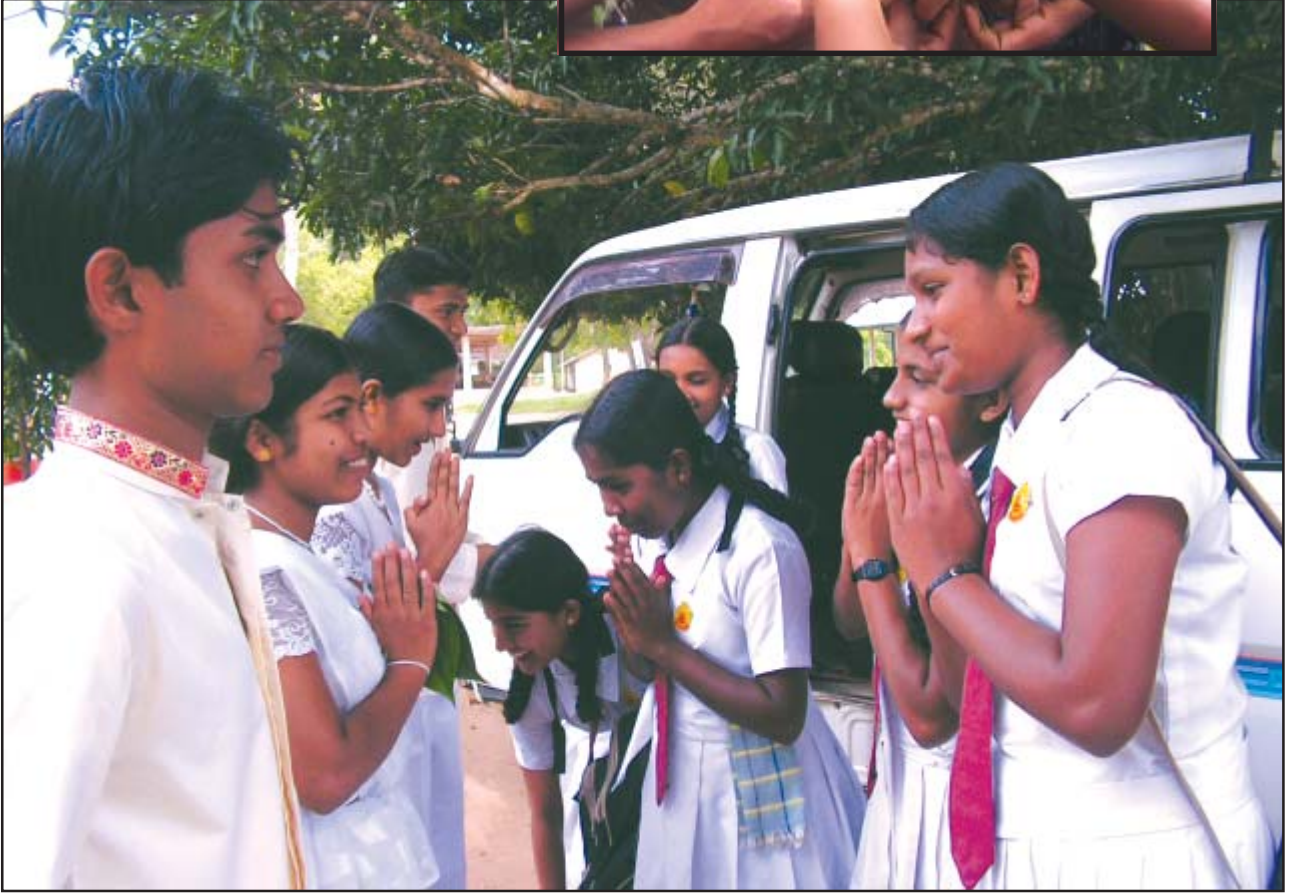
மாற்றுக் கொள்கைகளுக்கான நிலையம்