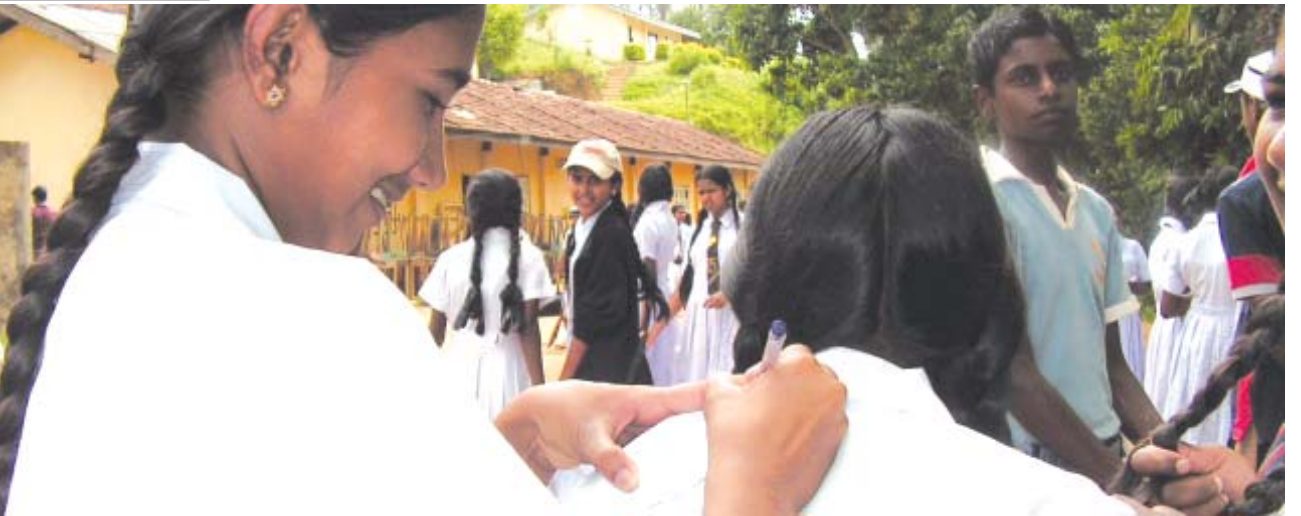
சாரனியா வித்தியாலயத்தில் இடம்பெற்ற வதிவிட முகாம் நிறைவில் “ஆட்டோகிராப்” எழுதும் காட்சி

நாம் பலதையும் வரவேற்க வேண்டும். அதற்காக பல்வேறு இனங்களை சேர்ந்த சிறார்கள் மத்தியிலேயே கருத்துக்களைப் பரிமாறிக் கொள்ள சந்தர்ப்பம் வழங்கியமை வரவேற்க வேண்டிய செயற்பாடாகும். இங்கு அறிமுகமான சிறார்கள் தமது தொடர்புகளை எந்தளவுக்கு முன்னெடுத்து செல்வார்கள் என்பதிலேயே இம்முயற்சியின் வெற்றி தங்கியுள்ளது.