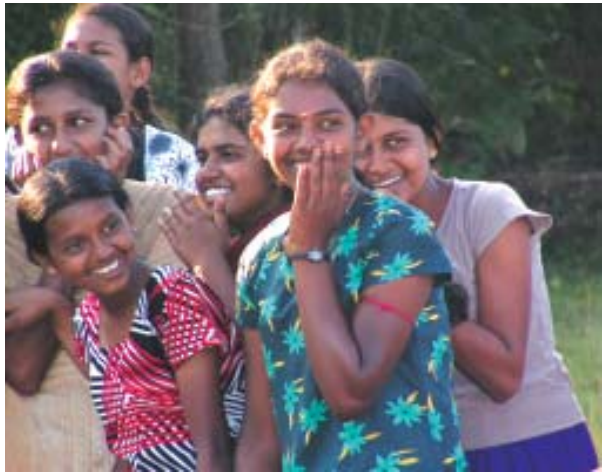
அம்/ கலஹிடியாகொட கல்லூரியில் இடம்பெற்ற முகாமில் மாணவிகள் குதூகலிக்கும் காட்சி