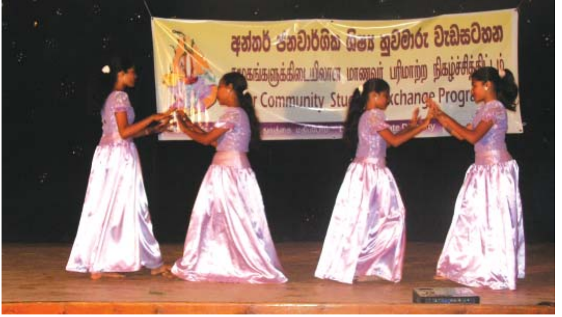
அ/ சாஹிரா வித்தியாலய முகாமில் கலாச்சார நடன நிகழ்வு.