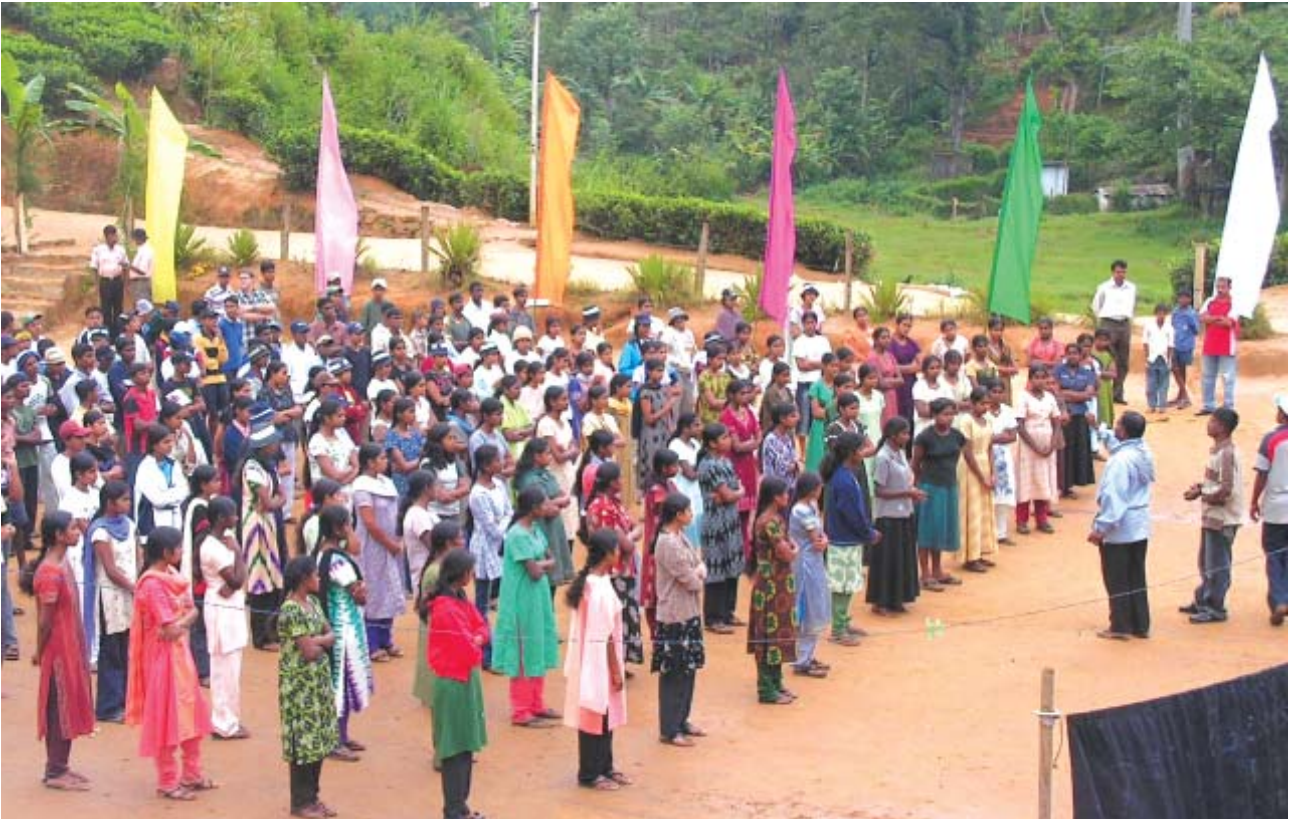
மஸ்கெலிய ப்ளம்ப்ரீல்ட் வித்தியாலயத்தில் இடம்பெற்ற வதிவிட முகாமில் மாணவர்கள் கள சுற்றுலா பற்றி அறுவுறுத்தப்படுகின்றனர்.