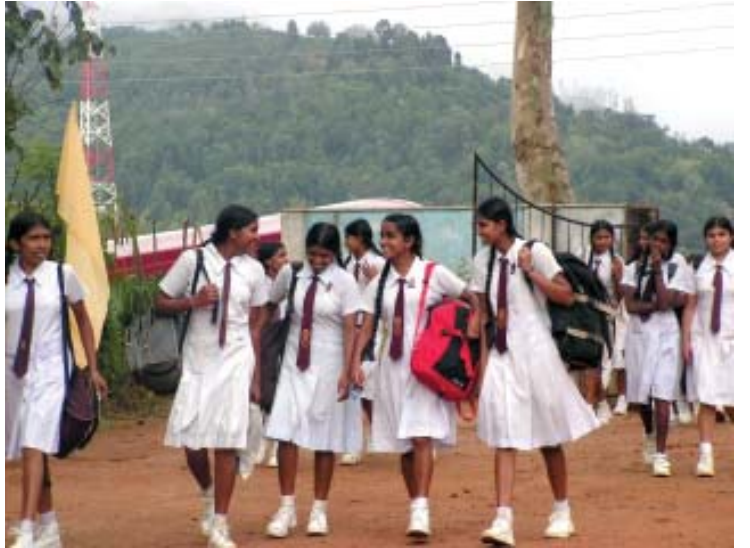
சார்னியா வித்தியாலயத்துக்கு வரும் கரகஸ்கட மாணவிகள்