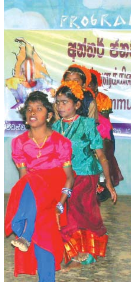
மஸ்கெலிய ப்ளம்பீல்ட் வித்தியாலயத்தில் இடம்பெற்ற முகாமில் கலாச்சார நிகழ்ச்சியில் ஈடுபட்டுள்ள ப்ளம்பீல்ட் மாணவியர்கள்.

முகாமின் இரண்டாவது நாளின் முதல் அங்கமாக மாணவர்கள் உடற்பயிற்சியில் ஈடுபட்டனர். கள சுற்றுலா அதன் இரண்டாவது அங்கமாக இடம்பெற்றது. அதை அடுத்து பகல் உணவு அளிக்கப்பட்டது.