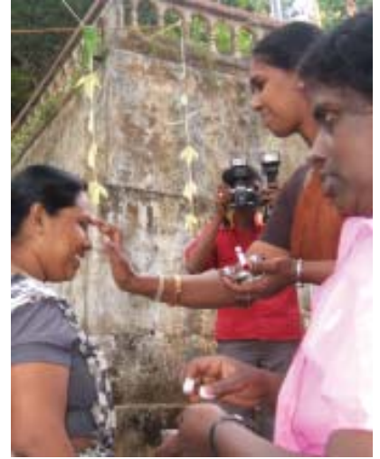
பசறை தவித்தியால ஆசிரியைகளால் ஹரிச்சந்திர ஆசிரியைகள் வரவேற்க படுகின்றனர்.

மீளாய்வு உரை லயனல் குருகே அவர்களால் நிகழ்த்தப்பட்டது.