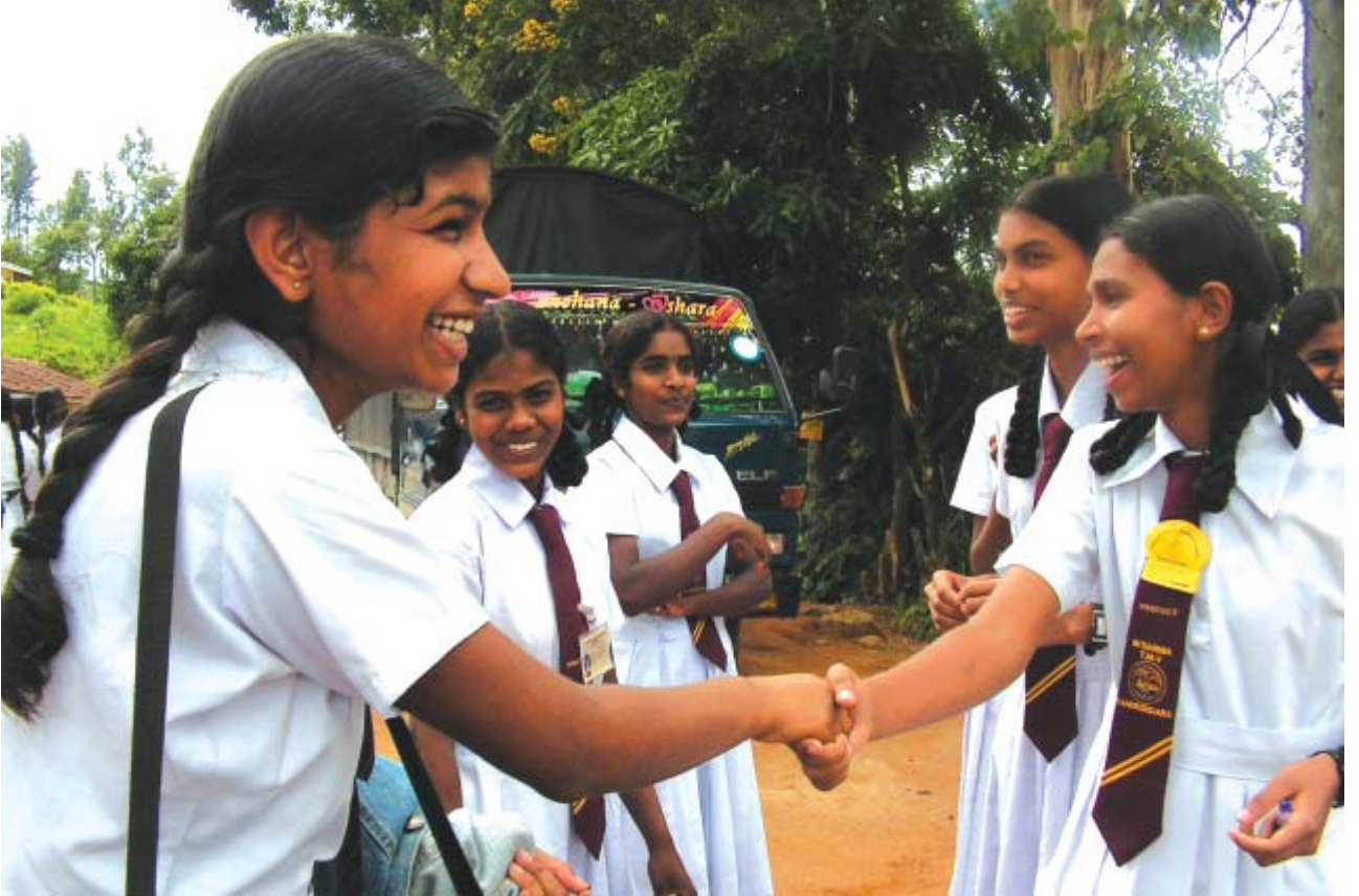
சாரனியா வித்தியாலய முகாமை முடித்துவிட்டு செல்லும் கரஸ்கொட மாணவி விடைபெறுகிறார்.