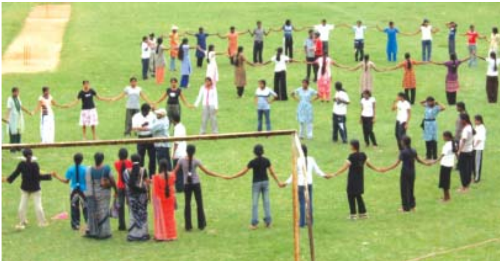
பஸ்ஸர த.ம.வித்தியாலய முகாமில் அனைவரும் ஒன்று கூடி விளையாட்டில் பங்குபற்றும் காட்சி

இலங்கையின் இளைஞர் யுவதிகளின் உழைப்பு திறனின் சரியான பயனை இன்னும் பெறுவதில்லை. அதற்காக தெளிவான நோக்குடன் எதிர்காலத்தைத் திட்டமிடல் வேண்டும். எதிர்கால அபிவிருத்தியின் அடிப்படைக் காரணியாக சிறுவர்கள் விளங்குகிறார்கள். அவர்களுக்குப் புத்தக அறிவுடன் பலதையும் வரவேற்பது போன்ற மனிதாபிமான குணாதிசயங்களை வளர்க்க இந்நிகழ்ச்சி ஒத்துழைப்பு நல்குகிறது. சமாதானத்தை தோற்றுவிக்க கல்வி உடன்படிக்கை மூலம் எடுக்க வேண்டிய எல்லா நடவடிக்கைகளையும் எடுக்கப் பூரண ஒத்துழைப்பை வழங்கலாம்.