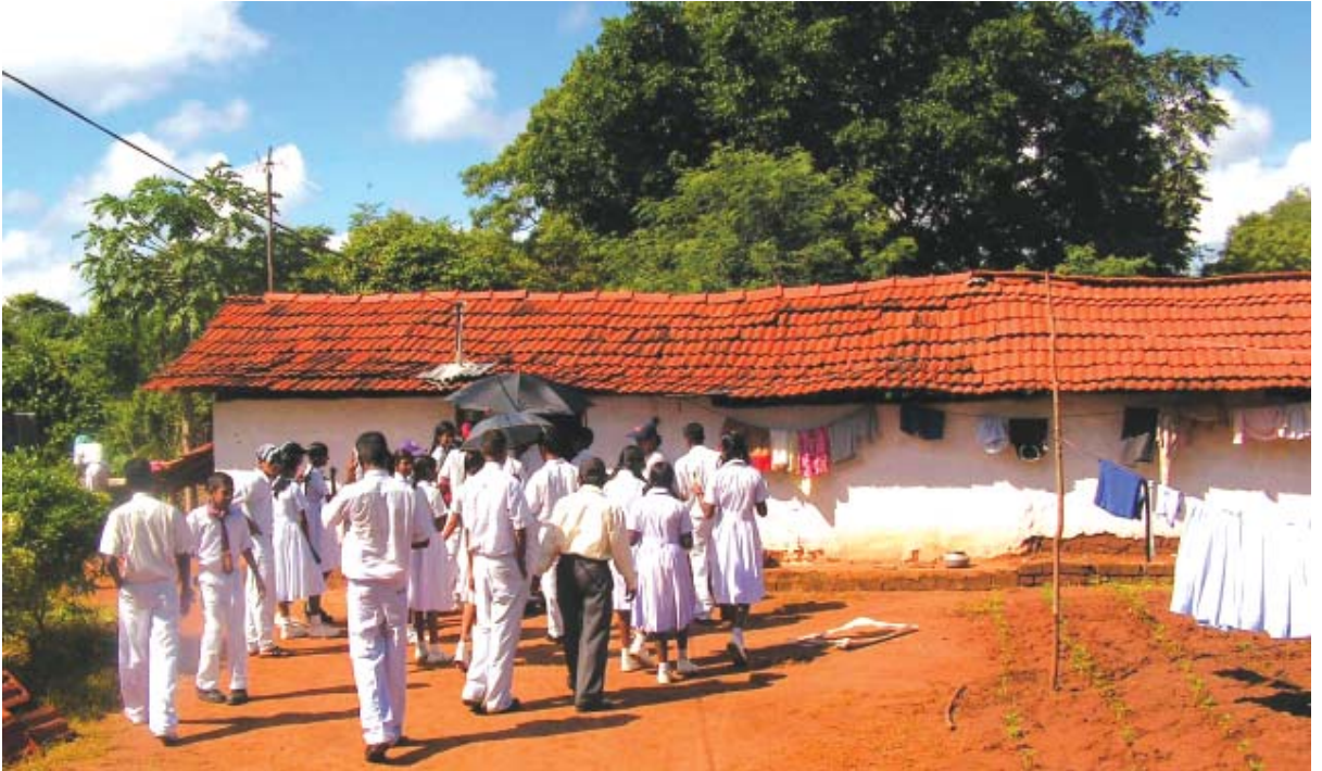
அனுராதபுர குகுலேவ முகாமில் கள சுற்றுலா நிகழ்வு

தமிழ் சகோதர சகோதரிகளை நாம் இனிதே வரவேற்கிறோம். இந்த உணர்வை வார்த்தையால் கூறிவிட முடியாது. பதுளை பிரதேச மக்களின்