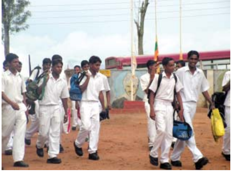
சார்னியா வித்தியாலயத்துக்கு வரும் கரகஸ்கட பாடசாலை மாணவர்கள்

இரவு 7.30 மணிக்கு கலாச்சார நிகழ்ச்சிகள் தொடங்கின. முகாமின் இறுதி நாள் மாணவர்கள் தெரிவித்த கருத்துக்கள் இதோ: