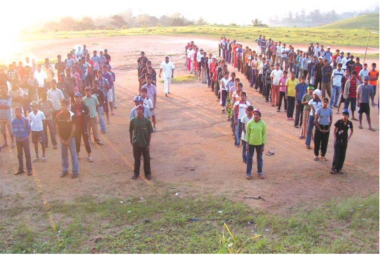
கரகஸ்கொட வித்தியாலய முகாமை ஆரம்பித்து மாணவர்கள் உடற்பயிற்சி செய்கிறார்கள்.