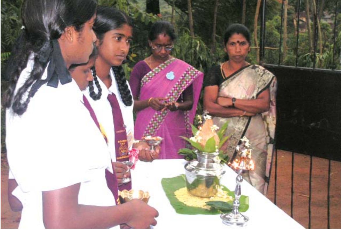
வரவேற்கக் காத்திருக்கும் சார்னியா வித்தியாலய ஆசிரியர், மாணவிகள்