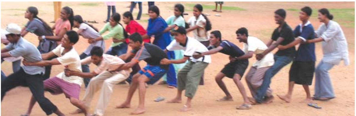
அ/ ஹரிஸ்சந்திர ம.வித்தியாலயத்தில் நடைபெற்ற முகாமின் போது விளையாட்டில் பங்குபற்றும் மாணவ மாணவிகளில் சிலர்