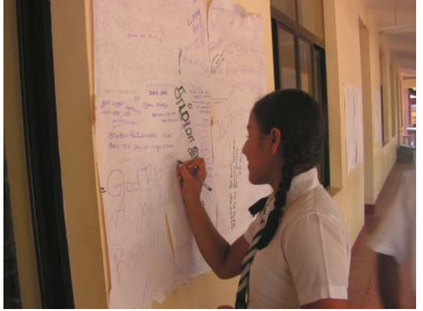
அ/ வலிசிங்க ஹரிஸ்சந்திர வித்தியாலய முகாமில் ரூபகார்த்த குறிப்பு