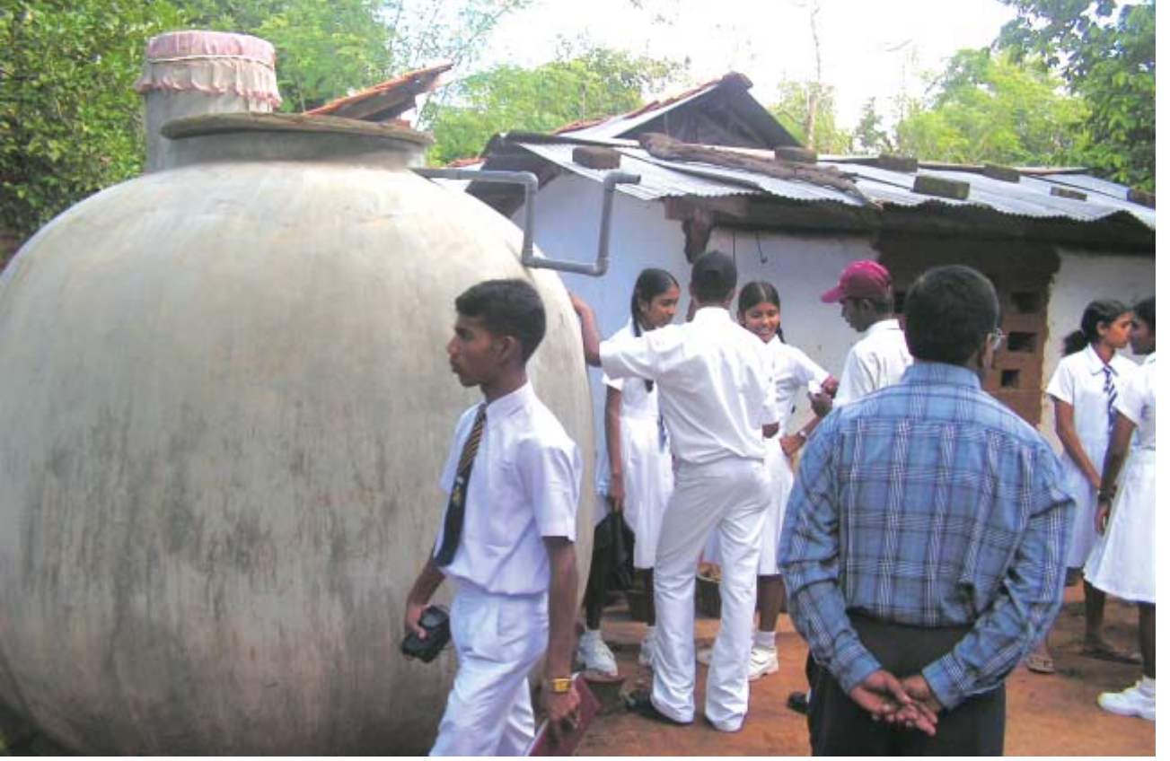
ஹரிஸ்சந்திர முகாமின் களச் சுற்றுலா