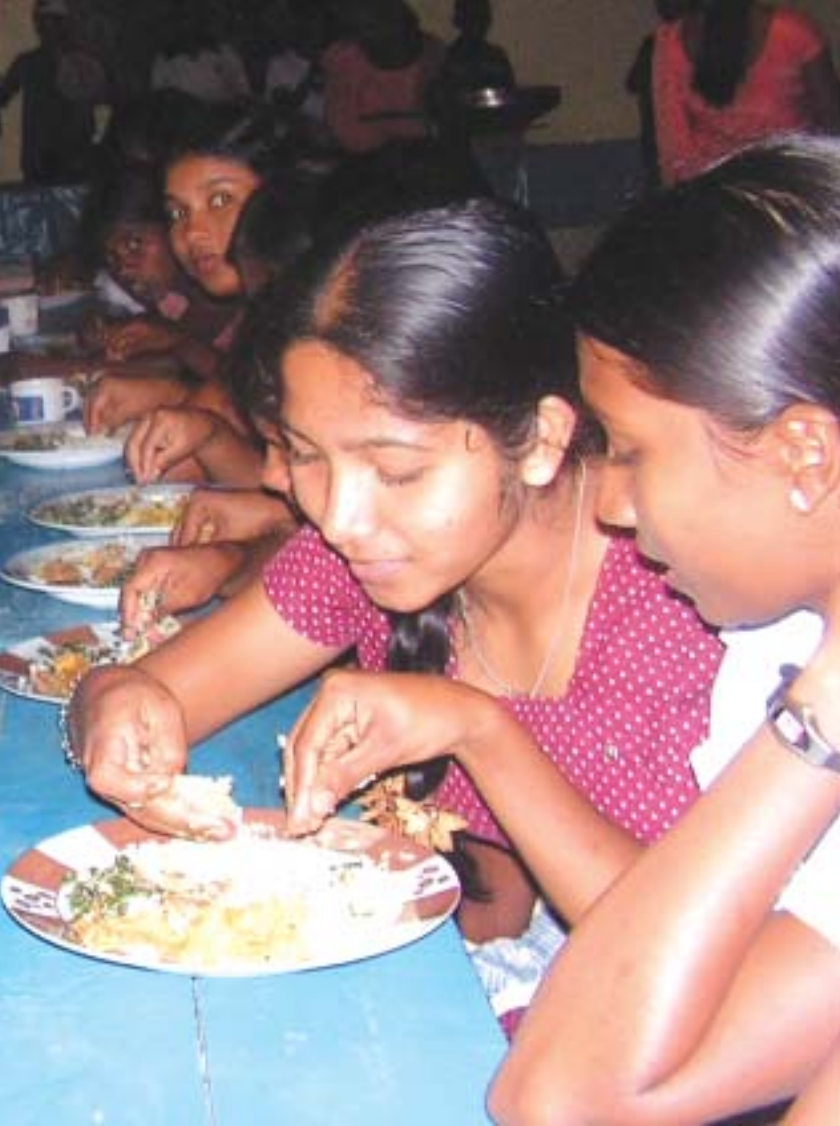
கலஹிடியாகொட முகாமில் இரவு உணவு உட்கொள்ளத் தயாராகும் மாணவர்கள்.