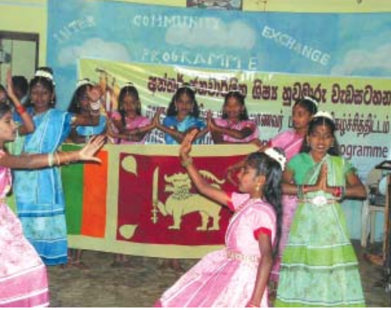
புளம்பீல்ட் மாணவியர்களின் நடனக் காட்சி