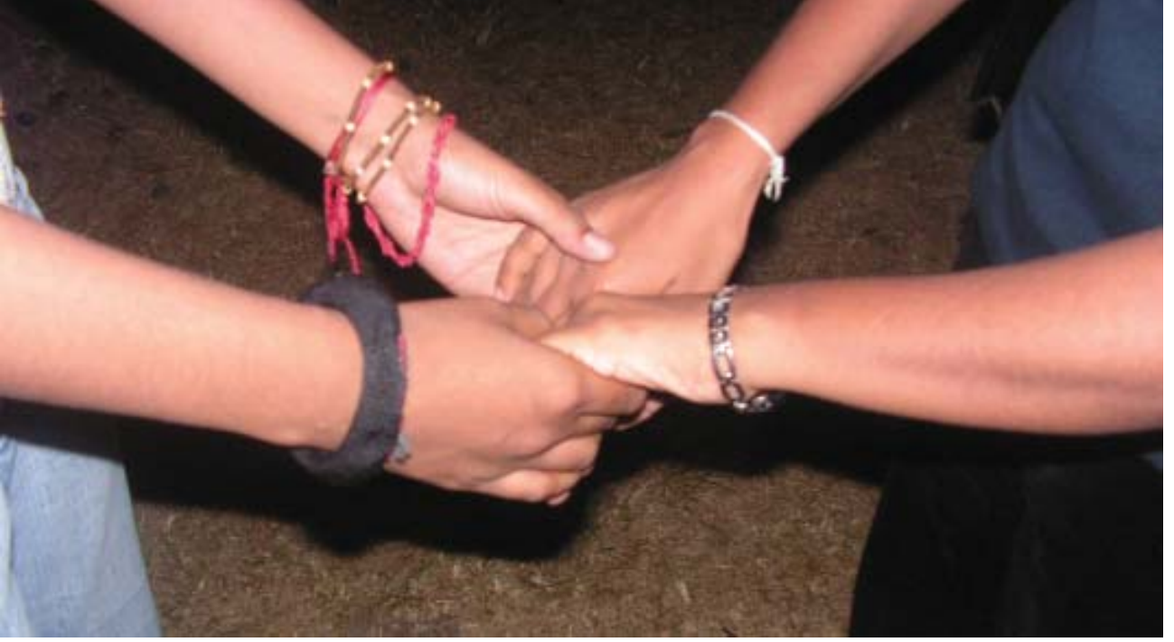
கைகோர்த்துக் கொண்ட மனித நேயம்