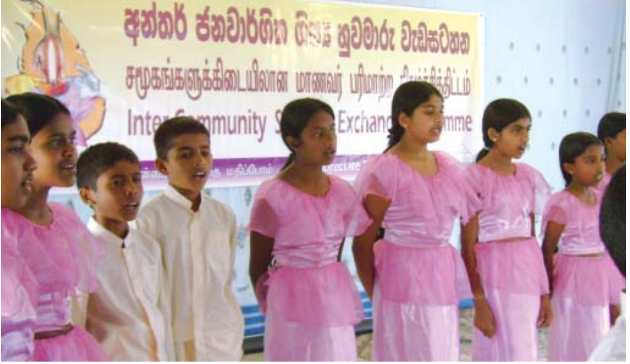
கரகல்கட வித்தியாலய முகாமில் மாணவர்கள் தேசிய கீதம் இசைக்கின்றனர்.