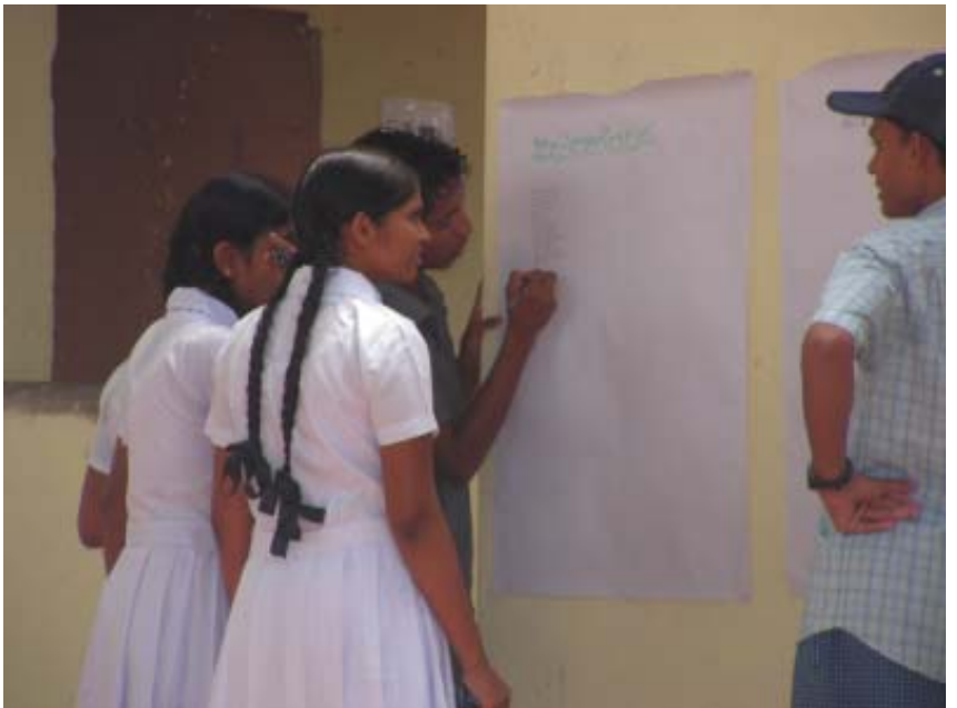
சகோதர அன்பின் அடையாளம்