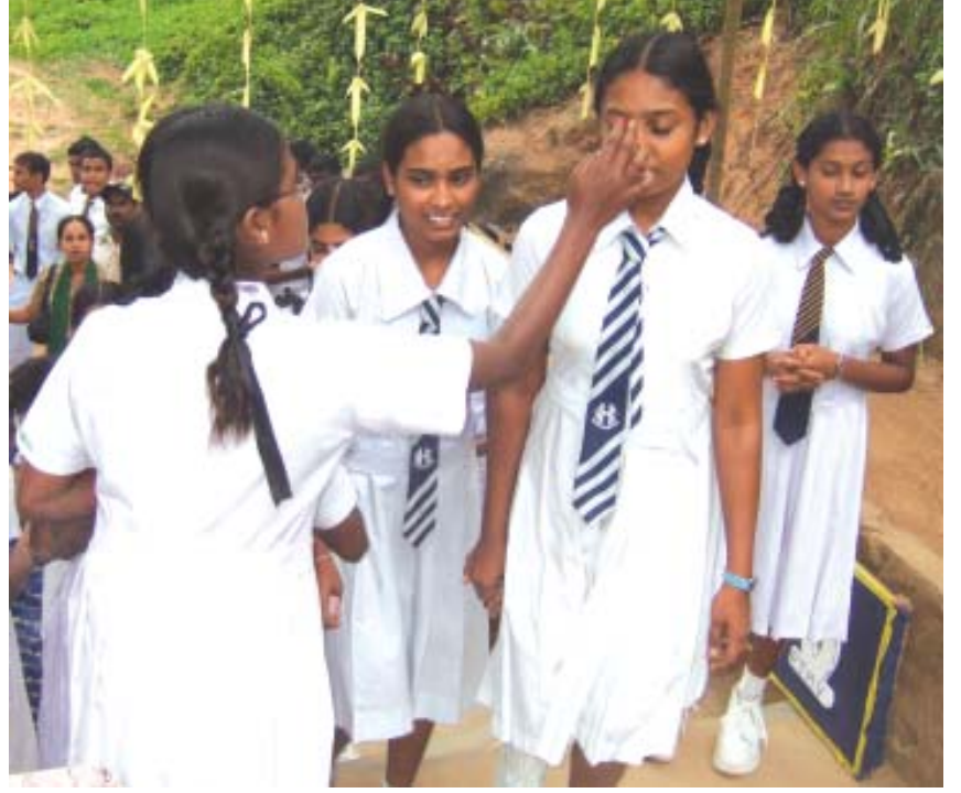
பஸ்ஸர த.ம.வித்தியாலத்தில் நடைபெற்ற முகாமின் போது அப் பாடசாலை மாணவர்களினால் சம்பிரதாயப்படி அ/ ஹரிஸ்சந்திர ம.வி. மாணவர்களை வரவேற்கும் சிலர்.

அநுராதபுரம் ஹரிஸ்சந்திர பாடசாலை மாணவர் குழுவொன்று பசறை தமிழ் வித்தியாலயத்துக்கு அழைத்து சென்று அப்பாடசாலை மாணவ மாணவியர்களையும் அவர்கள் வசிக்கும் தோட்டச் சூழலையும் கண்கூடாகப் பார்க்கும் சந்தர்ப்பம் ஏற்படுத்திக் கொடுக்கப்பட்டது. மேலும் தமிழ் மாணவர்களுக்குத் தம்மை விட முற்றிலும் மாறுபட்ட வாழ்க்கை வட்டத்தில் வளர்ந்த சம வயது மாணவர்களின் அனுபவங்களைப் பகிர்ந்து கொள்ள களம் அமைப்பதும் இதன் நோக்கமாகும். இரண்டு இனங்களைச் சார்ந்த இம்மாணவர்களை பல குழுக்களாகப் பிரித்து அவர்களுக்கு பல்வேறு பயிற்சிகளை வழங்கியதன் மூலம் அவர்களின் திறமைகளை வெளிக் கொணர்வதும் தோட்டப்புற வாழ்க்கை நிலையை நேரில் காணச் சந்தர்ப்பம் அளிப்பதும் சமய மற்றும் கலாச்சார அடையாளங்கள் பற்றிய அறிவை புகட்டுவதுமாக பல்வேறு நோக்கங்கள் நிறைவேற்றப்பட்டன.