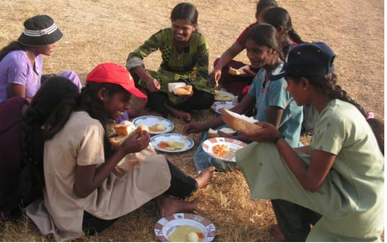
உணவு உட்கொள்ளும் காட்சி