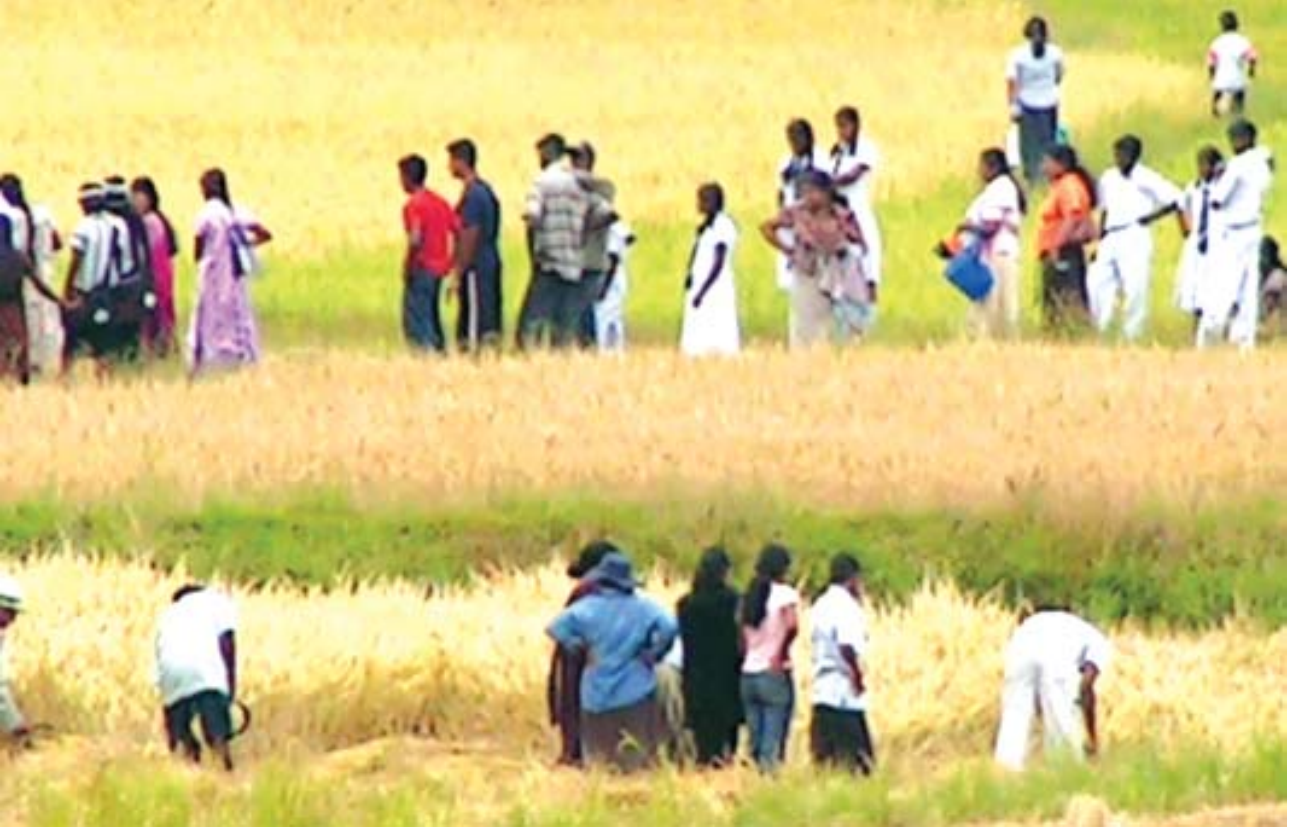
கு/ இந்து வித்தியாலய முகாம் கள சுற்றுலாவில் அனுபவங்களை பகிர்ந்து கொள்ளும் மாணவர்கள்.