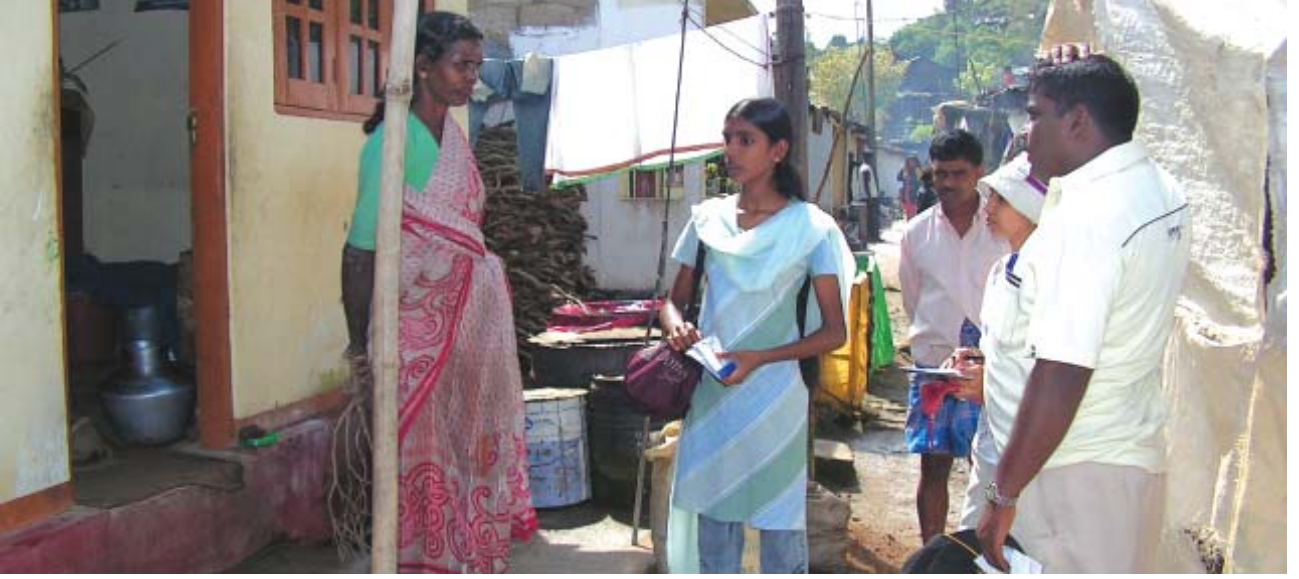
புலம்பீல்ட் தோட்டத்தில் குருணாகல மாணவர்கள்