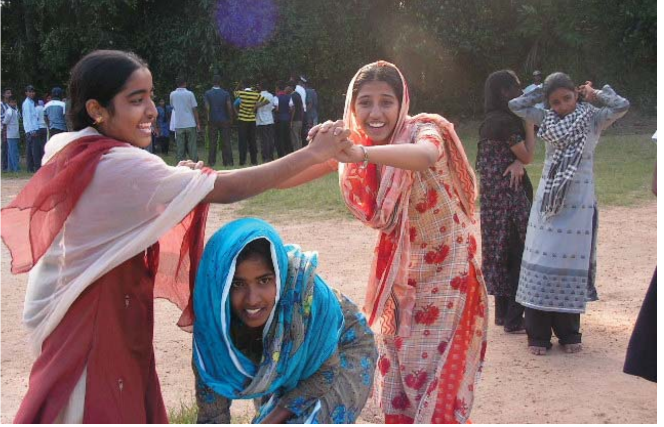
மடுல்ல வித்தியாலய முகாமின் விளையாட்டு நிகழ்வு