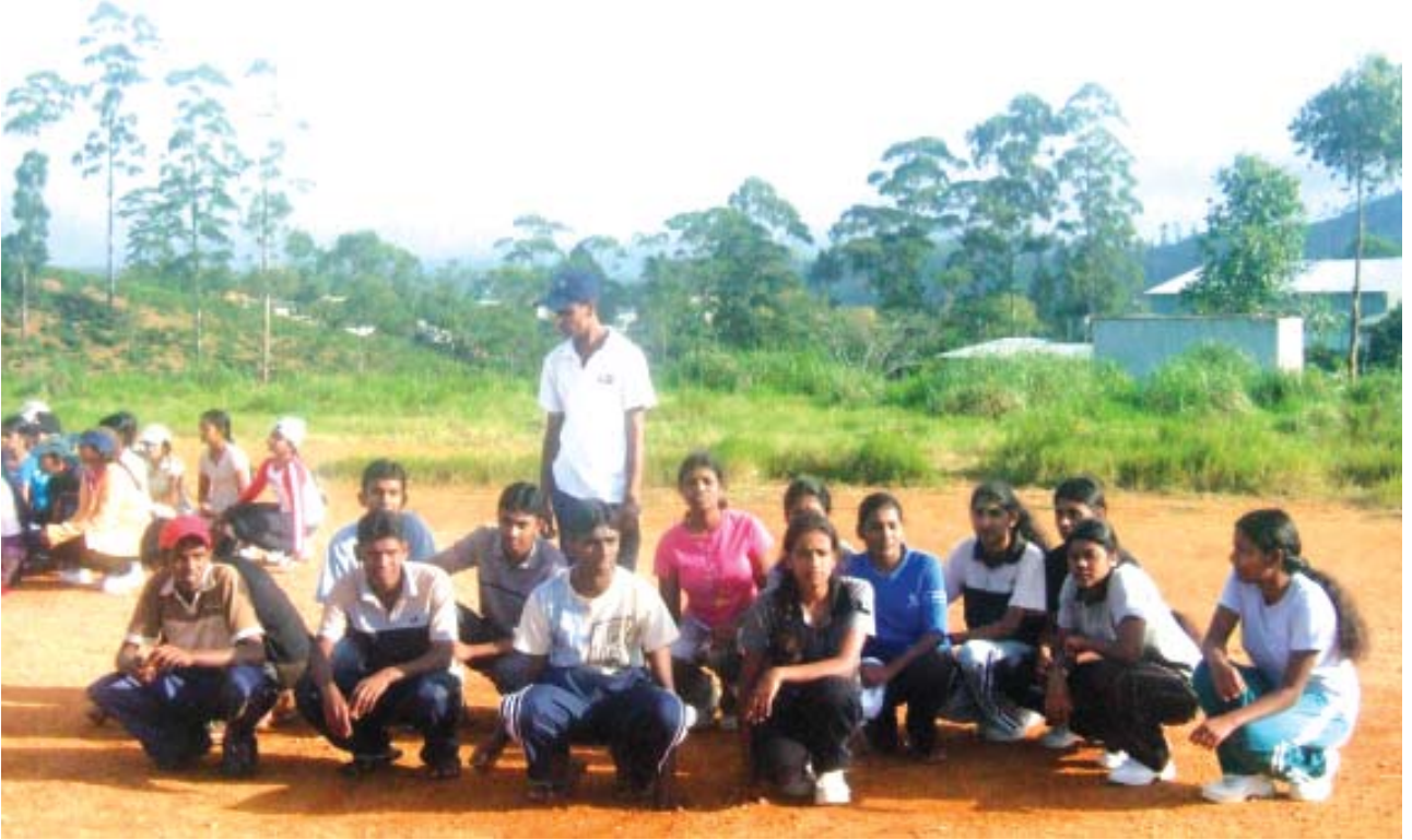
ஹைலன்ட்ஸ் கல்லூரி முகாமில் விளையாட்டு நிகழ்ச்சியொன்றில் பங்குபற்றுவதற்கு தயாராகவிருக்கும் மாணவர்கள்.