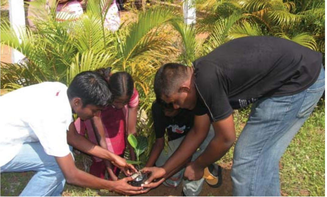
சாஹீரா வித்தியாலய முகாமில் ஞாபகார்த்த செடியை நாட்டும் மாணவர்கள்