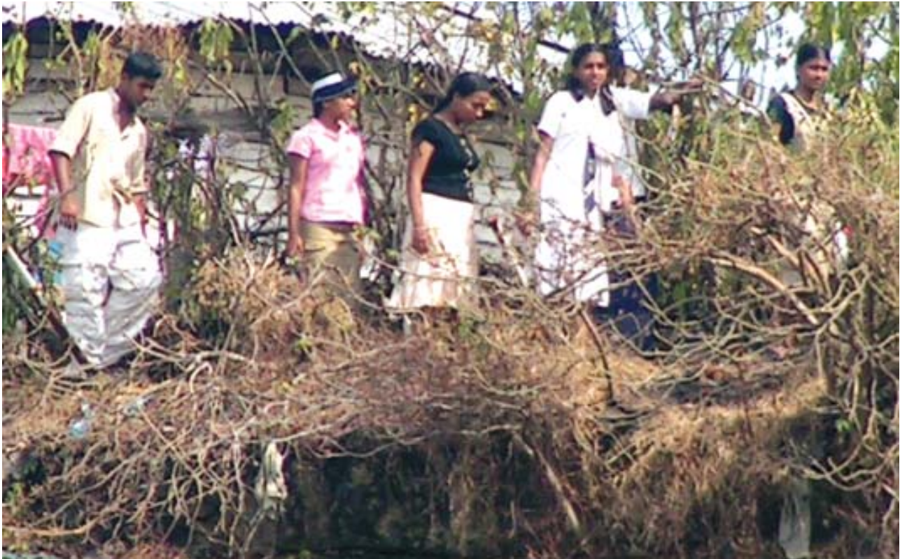
பசறை தமிழ் வித்தியாலயம் மற்றும் குருணாகல மாணவர்கள் குருணாகல இந்து வித்தியாலய கள சுற்றுலாவில்.