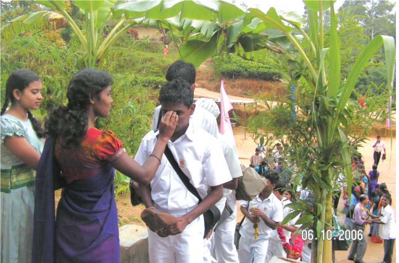
மஸ்கெலிய ப்ளம்ப்ரீல்ட் மாணவி கு/இந்து வித்தியாலய மாணவனை வரவேற்கும் காட்சி