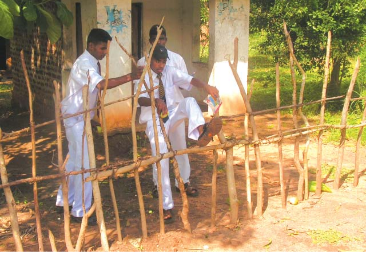
ஹரிஸ்சந்திர வித்தியாலய முகாமின் கள சுற்றுலாவில் ஈடுபடும் பசறை வித்தியாலய மாணவர்கள்.