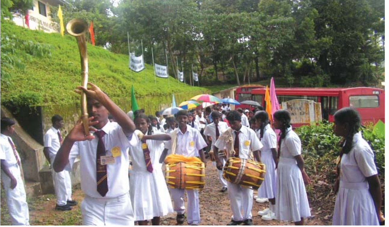
சாரனியா வித்தியாலய மாணவர்கள் சக மாணவர்களை வரவேற்கும் காட்சி