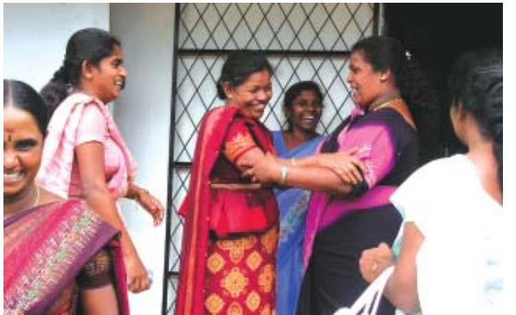
செங்கடகல ஆசிரியைகள் பதுளை ஆசிரியைகளுடன் மகிழ்ச்சியை பகிர்ந்து கொண்டனர்.