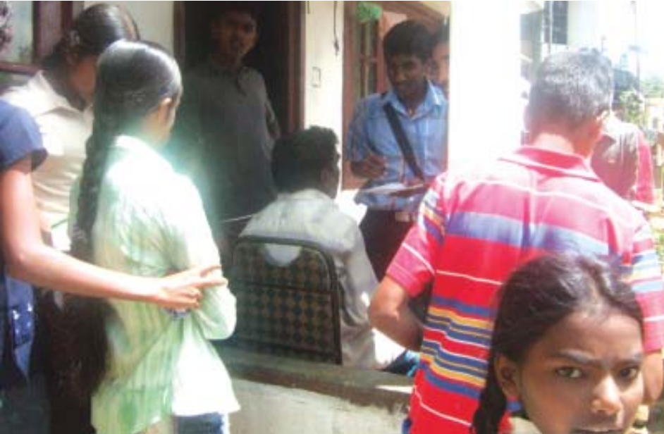
கள சுற்றுலா நிகழ்வின் போது.

உரையை அடுத்து பல்வேறு விளையாட்டு நிகழ்ச்சிகள் இடம்பெற்றன. மாலை வேளைகளில் கலாச்சார நிகழ்வுகள் இடம்பெற்றன. மூன்றாவது நாள் பாடசாலை பூமியில் இடம்பெற்ற சிரமதானப் பணியுடன் நிகழ்ச்சிகள் தொடங்கின. நிறைவு அமர்வாக மாணவர்களுக்கு கருத்துக் கூறச் சந்தர்ப்பம் அளிக்கப்பட்டது. கருத்துரைகளை அடுத்து பகல் உணவு உட்கொண்ட பின்னர் மூன்று நாள் முகாம் நிகழ்ச்சி நிறைவு பெற்றது.