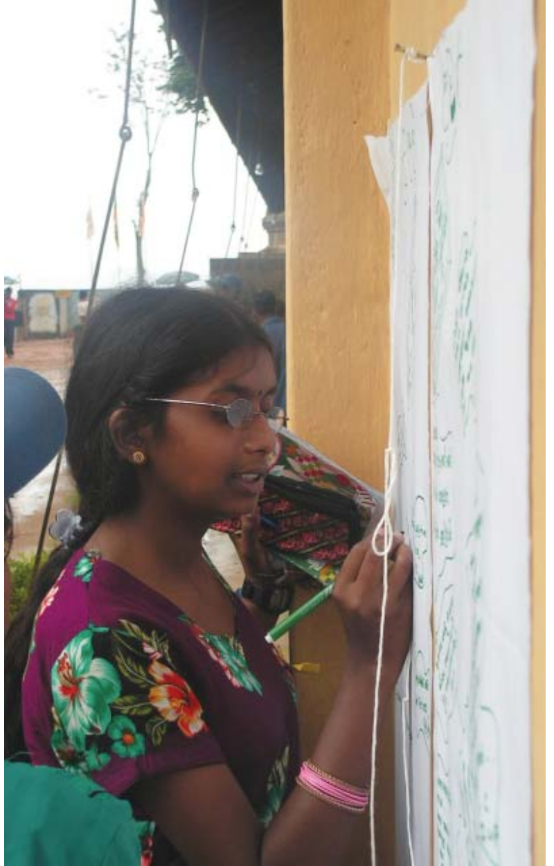
சார்னியா வித்தியாலய முகாமில் நினைவு வரிகள்