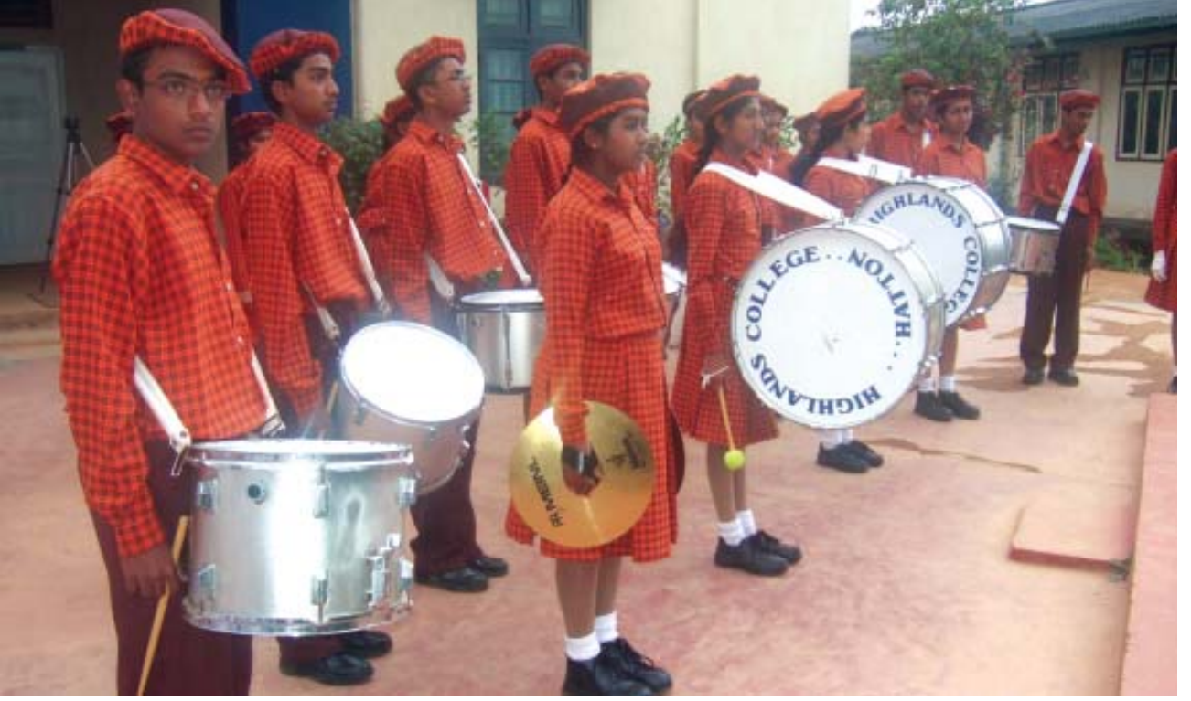
விருந்தினர்களான சக மாணவர்களை வரவேற்கவுள்ள ஹைலன்ட்ஸ் பேண்ட் வாத்திய குழு.