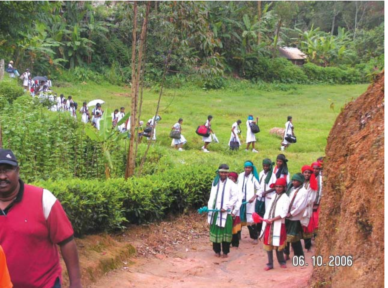
மஸ்கெலிய ப்ளும்பீல்ட் வித்தியாலய முகாமிற்கு வரும் எதுகல்புரவின் மாணவ மாணவிகளை ப்ளும்பீல்ட் வித்தியாலய மாணவ மாணவிகள் வரவேற்கும் தருணம் மாற்றுக் கொள்கைகளுக்கான நிலையம்

அதற்கு முன்னர் வாசனை அறியாத ப்ளும்பீல்ட் பாடசாலை மண்ணில் குருநாகல் பாடசாலை மாணவர்களின் பாதம் படிந்த அந்த கணம் கண்களைத் கொள்ளை கொண்டது.