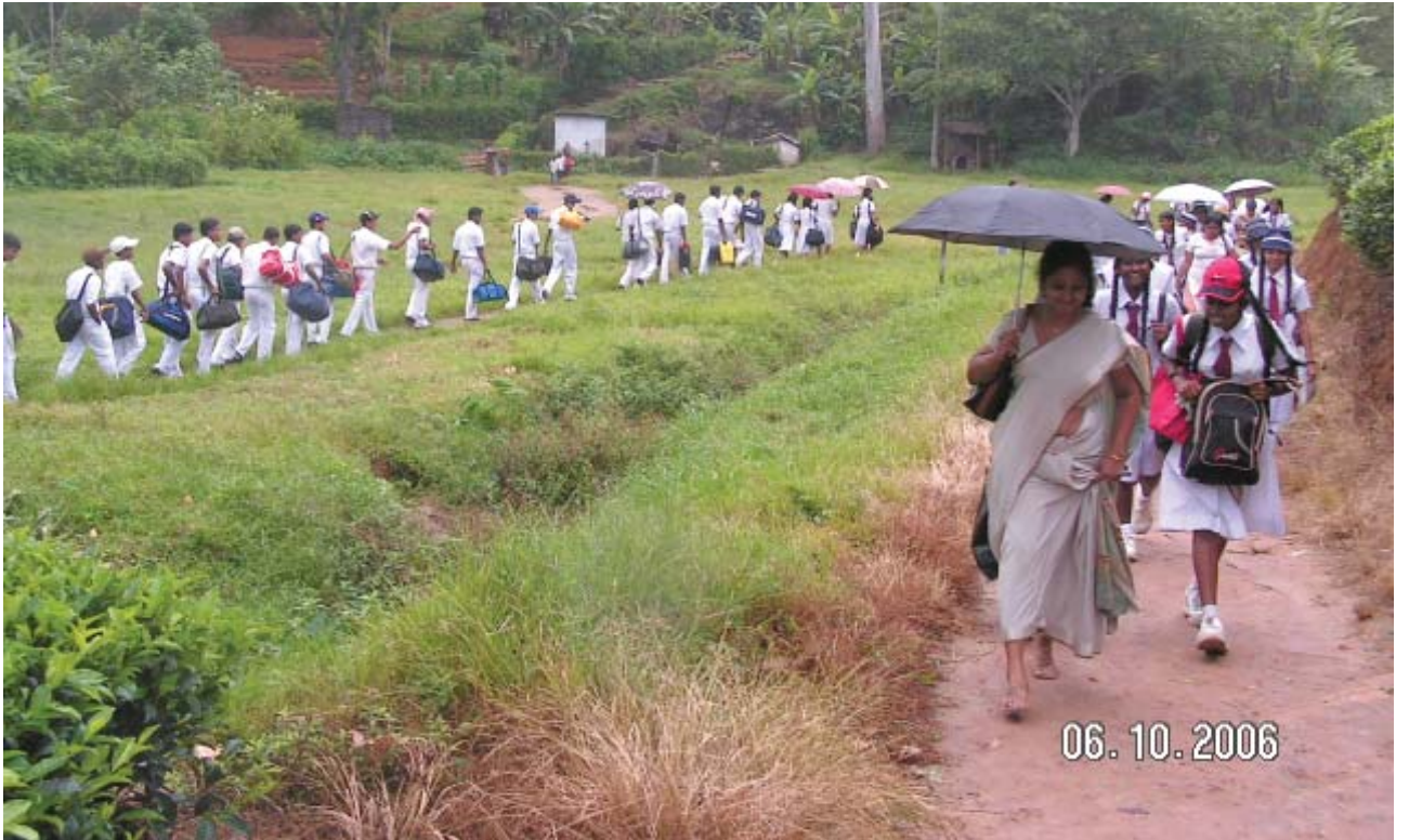
மஸ்கெலிய ப்ளம்பீல்ட் வித்தியாலய முகாமுக்கு வரும் குருணாகல மாணவர்கள்.