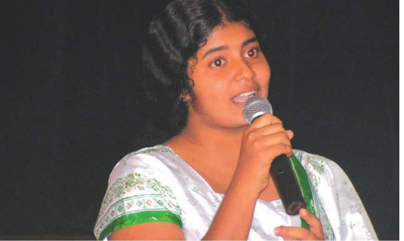
அ/ ஹரிச்சந்திர வித்தியாலயத்தின் இசங்கா என்ற மாணவி சபையினரை வழிநடத்துகின்றார்.