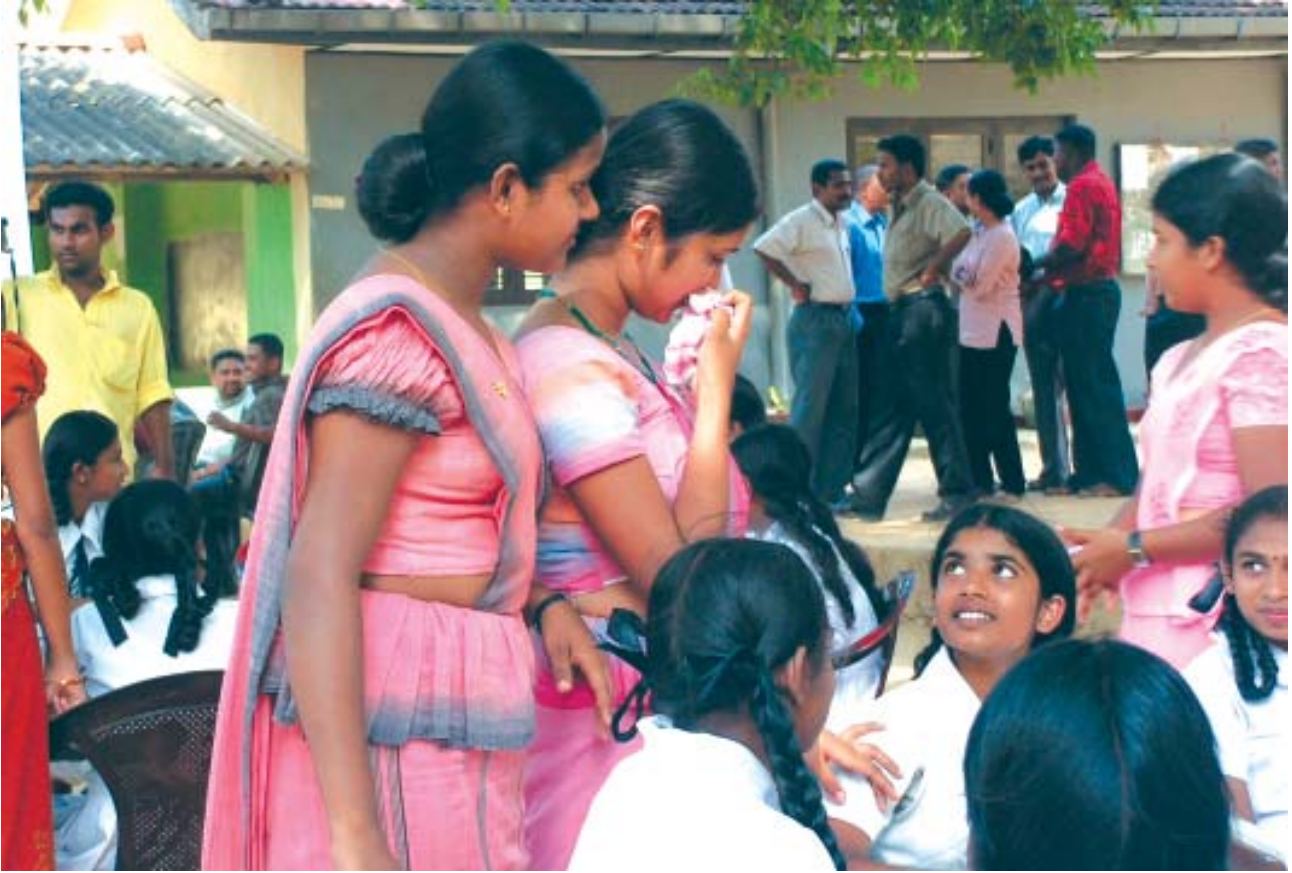
கலஹரிடியாகோட - பஸ்சறை மாணவர்கள்