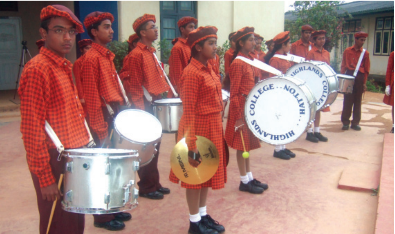
සිය ආරාධිත පාසල් පිළිගැනීම සඳහා මග බලා සිටින හයිලන්ඩ් විදුහලයේ තුර්ය වාදක කණ්ඩායම