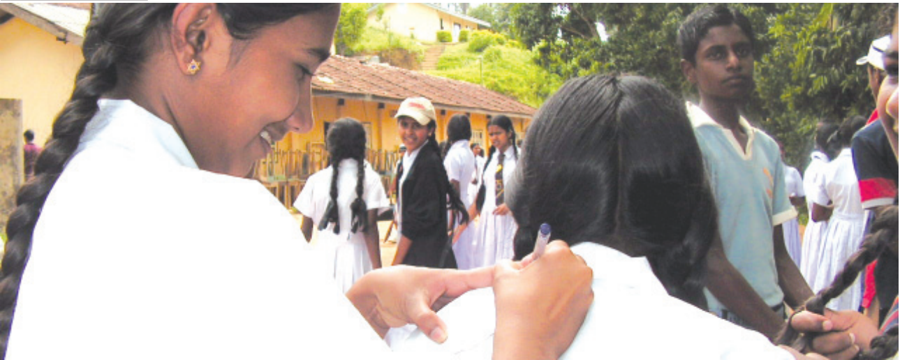
බ/සාරනියා විද්‍යාලයේ පැවති කඳවුර අවසානයේ මතක සටහන් තවත් සිසුවියකට ලබා දෙන කරගස්කඩ විද්‍යාලයේ සිසුවියක්

අප විවිධත්වයට ගරු කළ යුතු ය. ඒ සඳහා විවිධ ජාතීන්ට අයත් දරුවන්ට අදහස් හුවමාරු කර ගන්නට අවස්ථාව ලබාදීම වැදගත්. එහෙත් මෙහි සාර්ථකත්වය රඳා පවතින්නේ මෙහිදී හඳුනාගත් දරුවන් තම සම්බන්ධතා කොපමණ දුරට පවත්වාගෙන යනවා ද යන කරුණ මතයි.