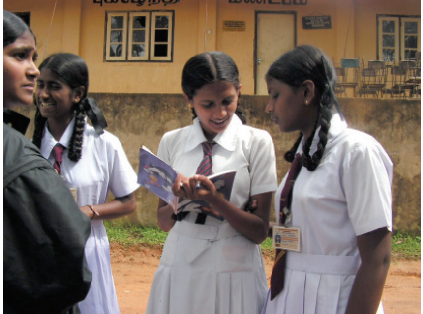
සමුගැනීමට පෙර මතක සහිටුනත් කරමින්

සිත උයනක පිපුණු මල් සොයා ආ ගමනේ සිතට මෙතුටක් නොලැබුණු සෙනෙහස ඔබගෙන් මට ලැබුණේ අහස විහිවීද කඳවුරු බැඳගෙන දින දෙකක් ම ගෙවුණේ ඉතින් මා හට යන්න අවසර සොයුරු සොයුරියනේ ඔබේ සෙනෙහස මගේ හඳ තුළ සදා රැඳේ කිසිදු මිලින නොවේ. අනුෂා නිලෝමි අම්/ රජගලතැන්න ම.විදුහල