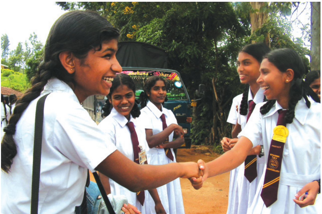
බ/ සාරනියා විද්‍යාලයේ පැවති කැවුර අවසානයේ එම විද්‍යාලයේ සිසුවියකට සමුදෙන කරගස්කඩ ම. වී. ශිෂ්‍යවරයා