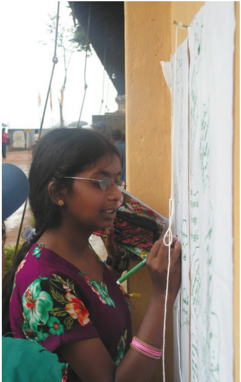
බ/සාර්නියා විදුහලේ දී කැටපත් පවුර අරලංකාරවත් කරන සිසුවියක්