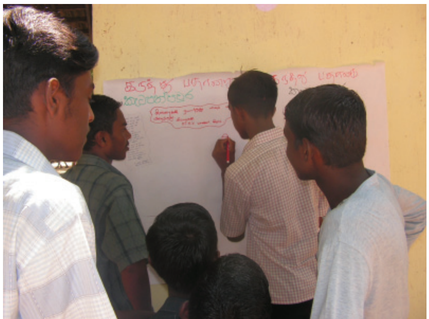
කැටපත් පවුරට අදහස් දෙමින්

සීතල සුළඟ මන්ද මාරුතය හා ගැටී වන විට කුරුළු ගී හාද දෙසවන ගැටෙන විට වික යායක පිපුණු මල් යායක් සේ