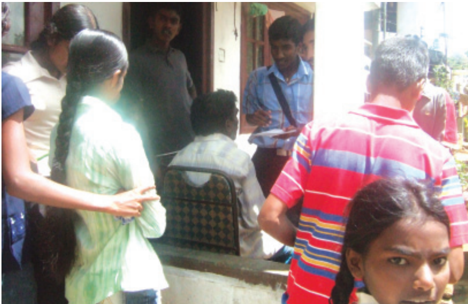
හයිලන්ඩ් විදුහලේ පැවති කඳවුරේ ක්ෂේත්‍ර වාර්තාවේ යෙදෙන සිසු සිසුවියන්

දෙසුමෙන් පසුව විවිධ ක්‍රීඩා තරග පැවැත්විණි. සවස් කල පැවති ආකර්ෂණීය අංගය වූයේ සංස්කෘතික සංදර්ශනයයි. තෙවැනි දිනය ආරම්භ වූයේ පාසල් බිමෙහි පැවති ශ්‍රමදානයෙනි. සමාජික සැසිය වශයෙන් සිසු සිසුවියන්ට හා ගුරුවරුන්ට තම අදහස් පළ කිරීමේ අවස්ථාව ලැබිණ. අදහස් දැක්වීමෙන් අනතුරුව දිවා ආහාර ගැනීමෙන්. තෙදිනක කඳවුරු වැඩසටහන නිමාව දැක්කේ ය.