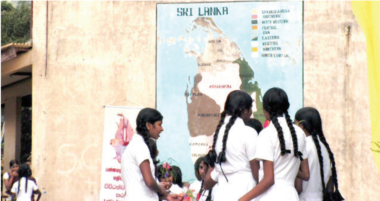
මහ/ කරගස්කඩ ම.වි. පැවති කඳවුර අතරතුර සුභද්‍ර පිළිසඳුරක යෙදී සිටින ශිෂ්‍යාවන් පිරිසක්

මගේ නම වෙල්ලතමිබ් අමීරදීන් මීට පෙර කියවුණා සිංහල මුස්ලිම් සබඳතා ගැන මම කියන්නේ මුස්ලිම් දෙමළ සබඳතා ගැන. උතුරු නැගෙනහිර මිත්‍රත්වයට දැන් මොකද වෙලා තියෙන්නේ? අප, අප අතරින් ම නැති වූ වටිනා දෙයක් සොයමින් සිටිනවා. නිදහස් සැමරුවක් කෝ අපට නිදහසක්? කෝ නිදහස් සටහන්. මෙයට උත්තර ඔබම සෙවිය යුතු යි. අද අපි දමුපු පදනම අනාගත නායකයන් වශයෙන් ඔබ විසින් ශක්තිමත් කළ යුතු ය.