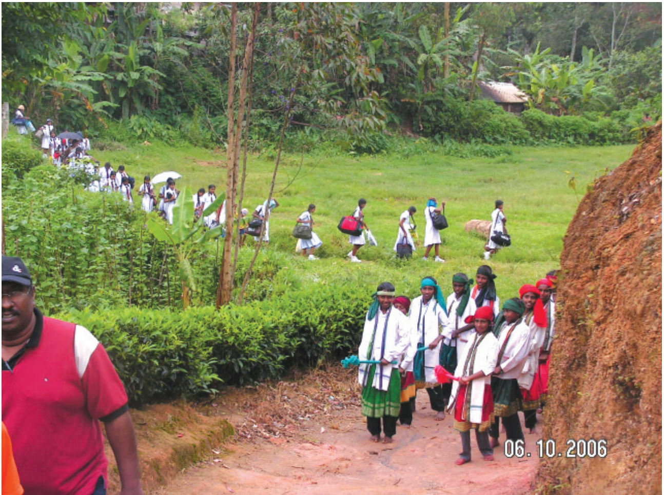
මස්කෙළිය බිලුම්ඟිල්ඩි විදුහල් කඳවුරට පැමිණෙන ඇතුගල්පුරයේ ආරාධිත සිසු සිසුවියන් බිලුම්ඟිල්ඩි විදුහලේ සිසු සිසුවියන් විසින් පිළිගත් අවස්ථාවේ පිකල්ලි ප්‍රතිපත්ති කේන්ද්‍රය

කිසි දා පහසු විඳ හැකි බිලුම්ඟිල්ඩි විදුහල් බිමෙහි ඇතුගල් පුර දැරුවන්ගේ පා ගැටෙන මොහොත අසිරිමත් දසුනක් මවා පෑවේ ය.