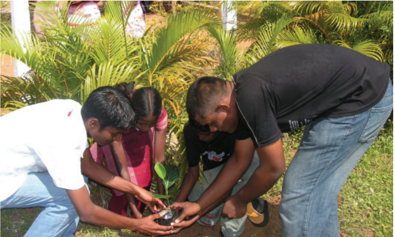
අ/සහිරා ම.වී. පැවති කඳවුරේ සිහිවටන පැල සිටුවීමේ යෙදී සිටින කු/ගිනිද ම.වී, මාතලේ මැදබැදිද ම.වී, අ/ වීචේකාතන්ද හා අ/ සහිරා සිසු සිසුවියන් පිරිසක්