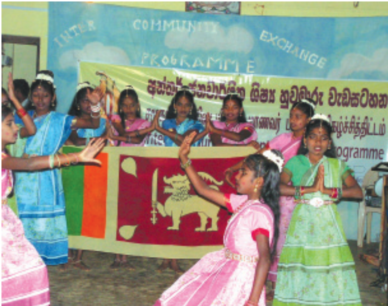
ඩිලුම්ලිඳි විදුහල් සිසුවියන් පිරිසක් නර්තනයේ යෙදෙමින්...

ඉන් අනතුරුව ගුණසේකර ගුණසේම ගේ මෙහෙයවීමෙන් ශ්‍රී ලංකාවේ ජන සාහිත්‍ය පිළිබඳ ව හැඳින්වීමක් සිදු කෙරිණ. සෙන්දිල් සිව්ඥානම් මහතා පරිවර්තනයෙන් සහාය විය. ජන සාහිත්‍ය ඔස්සේ පිළිබිඹු වන ජන විවිධත්වය සහ