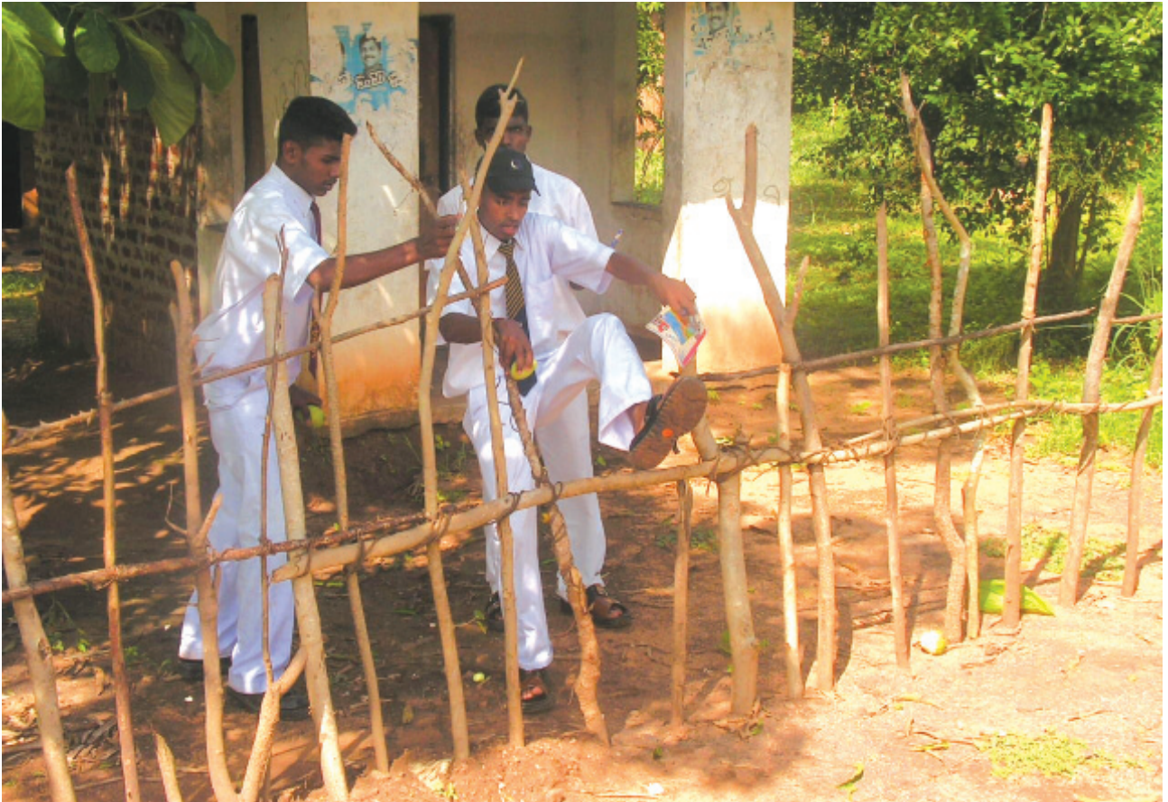
මහ/හරිස්චන්ද්‍ර ම.වී. කඳවුරේ ක්ෂේත්‍ර චාරිකාවක නියැලෙන ආරාධිත පස්සර දෙ.ම.වී. සිසුන් පිරිසක්