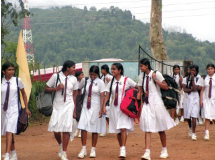
බ/සාර්නියා විදුහලේ කඳවුරට පැමිණෙන මග/කරගස්කඩ විදුහලේ සිසුවියන්