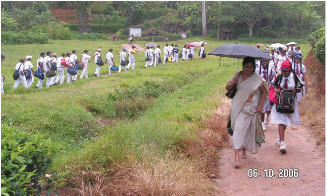
මස්කෙලය බිඳුම්මිලිඩි විද්‍යාලයේ කඳවුරට පැමිණෙන ඇතුගල්පුරයේ පාසල් ගුරුවරයන් හා සිසු සිසුවියන් පිරිස