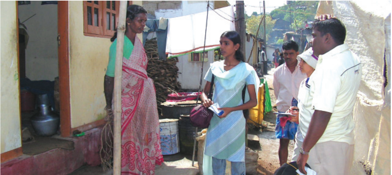
බලුම්ලිඳි වතුයායේ සෞභෞචාරිකාවේ යෙදෙන ඇතුළුපුරයේ සිසුන් පිරිසක්