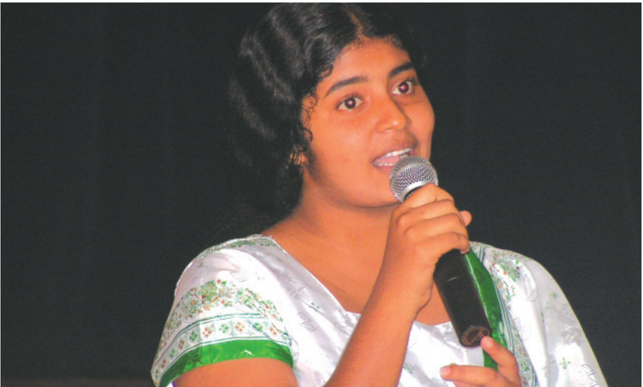
අ/වර්ස්වන්ද විද්‍යාලයේදී සිහිවටන පැල සිටුවීම සඳහා පස්සර දෙ.ම.වී. සිසුවකු විසින් සත්කාරක පාසලට පැලයක් පිළිගන්වමින්