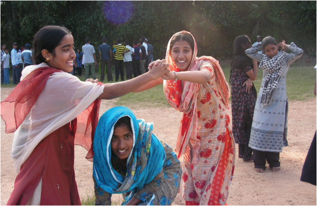
මඩුල්ල ම.ම.වී. පැවති කඳවුරේදී ආරාධිත පාසලක සිසුවියන් පිරිසක් ක්‍රීඩාවේ යෙදෙන අයුරු