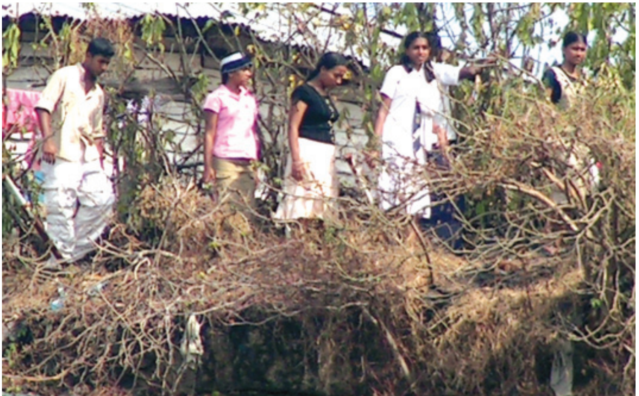
පස්සර දෙ.ම.වි. සිසුන් හා ඇතුගල්පුරයේ සිසුන් කු/ හින්දු දෙ. විද්‍යාලයේ පැවති කඳවුරේ හේතු වාර්තාවේ යෙදෙමින්