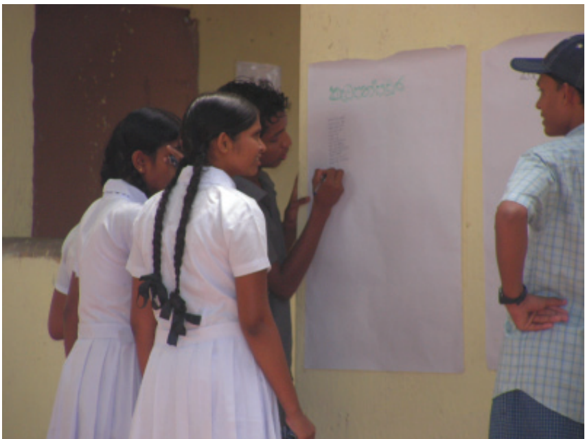
සහෝදර ප්‍රේමයෙන් කැටපත් පවුරට සටහන්