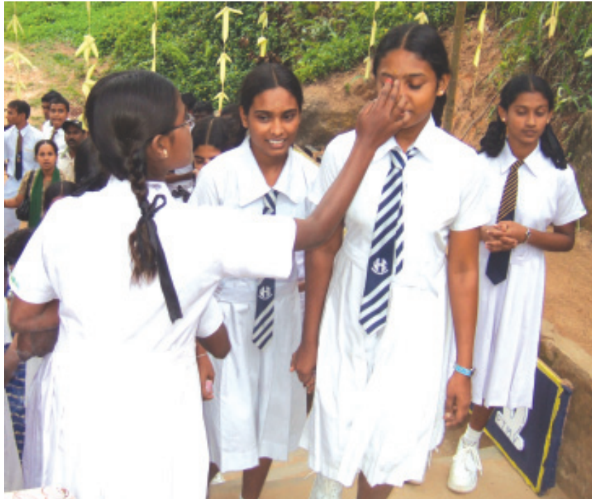
පස්සර දෙමළ ම.වි. පැවති කඳවුරේ දී එම විදුහලේ සිසුවියන් විසින් වාර්තානුකූලව අනු/හරිශ්චන්ද්‍ර ම.වි. සිසුවියන් පිළිගන්නා අයුරු

ජන වර්ග දෙකකට අයත් මෙම සිසු පිරිස් කණ්ඩායම් හත ලවා විවිධ ක්‍රියාකාරකම් කිරීමෙන් ඔවුන්ගේ නිර්මාණාත්මක හැකියාවන් ඵල දක්වන්නට අවස්ථාව ලබා දීමත්, වතු ලැයිමිවල ජීවිතය පිළිබඳ ජීවමාන අත්දැකීම් ලබා දීමත් ආගමික සහ සංස්කෘතික අනන්‍යතාව පිළිබඳ අවබෝධයක් ලබා දීමත් මෙහි දී සිදු කෙරිණ.