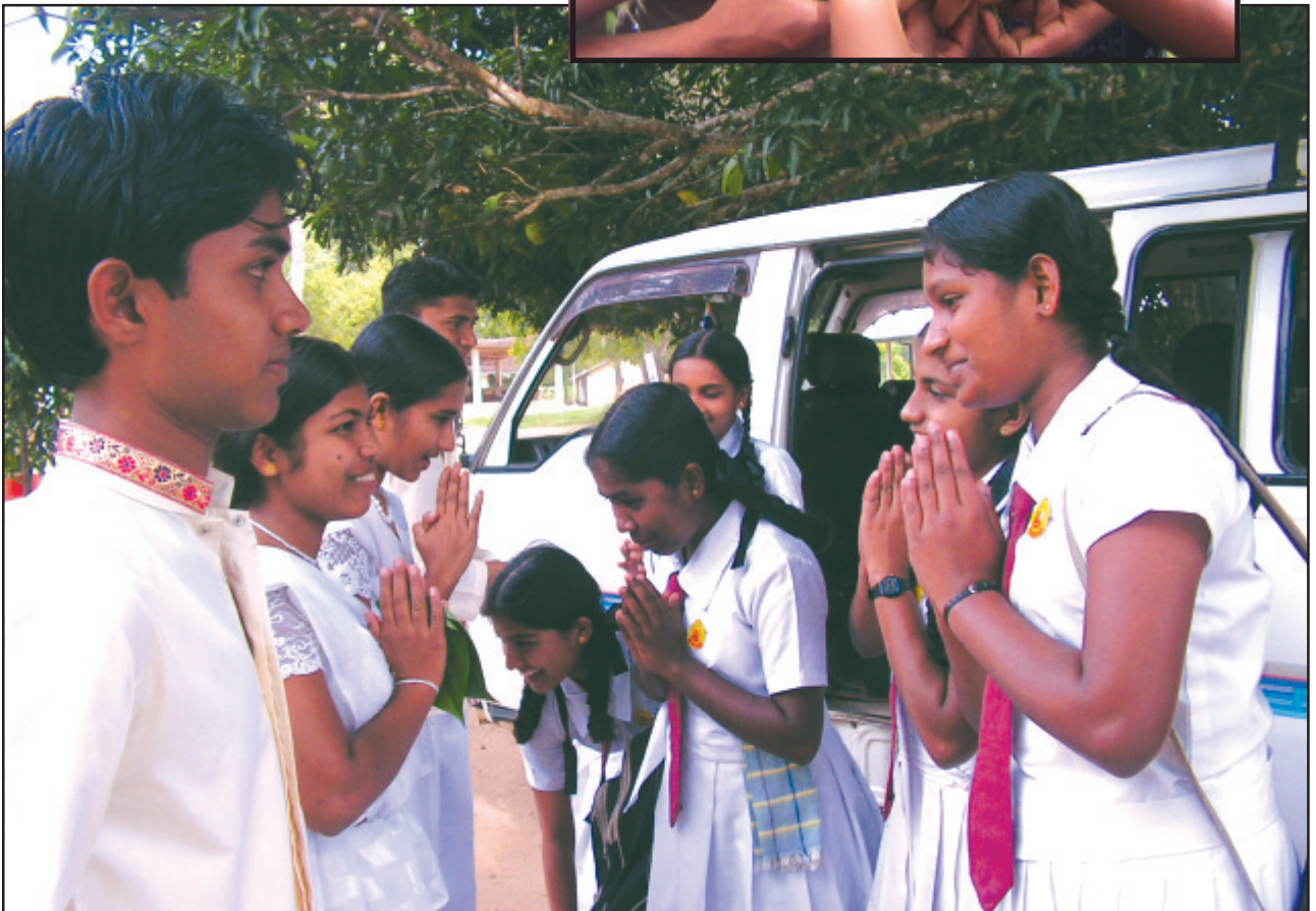
විකල්ප ප්‍රතිපත්ති කේන්ද්‍රය