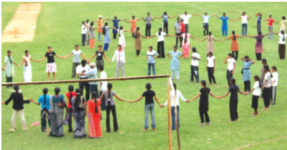
පස්සර දෙමළ ම.වි. පැවති කඳවුරේ දී සියලු දෙනා එක් ව ක්‍රීඩාවේ නිරතවන අයුරු

ශ්‍රී ලංකාවේ තරුණ තරුණියන්ගේ ශ්‍රම සම්පතින් තවමත් නිසි ප්‍රයෝජන ගෙන නැහැ. ඒ සඳහා පැහැදිලි දැරුණයක් අනුව අනාගතය සැලසුම් කළ යුතු යි. අනාගත සංවර්ධනයේ පදනම වන්නේ දරු පරපුර යි. ඔවුනට පහ පොතේ දැනුම මෙන් ම විවිධත්වය ගරු කිරීම වැනි මානුෂික ගුණාංග ඇති කිරීමට මේ වැඩ පිලිවෙළින් සහයෝගයක් ලැබෙනවා. සාමය ඇති කිරීම සඳහා අධ්‍යාපන ප්‍රඥප්තිය ඔස්සේ ගත හැකි පියවර ගැනීමට පූර්ණ සහයෝගය ලබා දෙනවා.