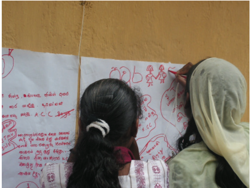
මිත්‍රත්වයේ සහිද්‍රවත් වක් කරමින්

දම්ප මිතුරනි දැනුණි ඔබගේ දයාබර බව හොමැකේවි මතකයෙන් මේ ගත වූ තෙදින සුනිල් K.C.C.