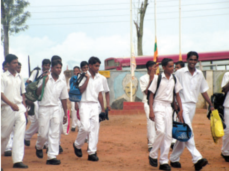
බ/සාර්නියා විදුහලේ කඳවුරට පැමිණෙන මග/කරගස්කඩ විදුහලේ සිසුන්

ප.ව. 7.30ට පමණ සංස්කෘතික සන්දර්ශනය ආරම්භ විය. කඳවුරෙහි අවසාන දින සිසු සිසුවියන් දැක්වූ අදහස් මෙසේ ය.