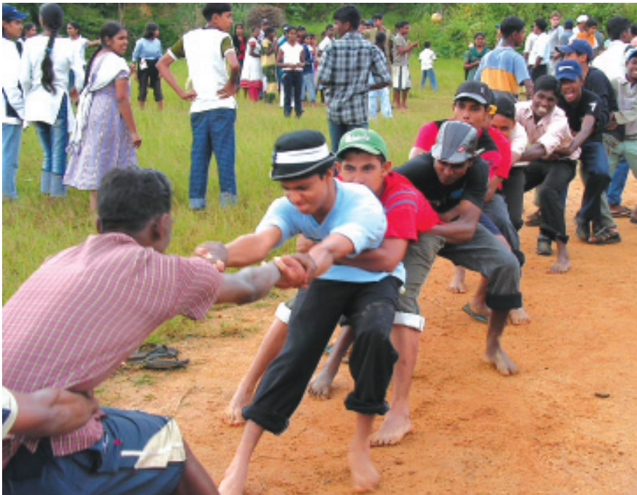
බිලුම්ඊල්ඩ් විදුහලේ පැවති කඳවුරේ දී සිසු සිසුවියන් පිරිසක් ක්‍රීඩාවේ යෙදෙන අයුරු

සිසුන්ගේ අදහස් දැක්වීම්වලින් අනතුරු ව ශාන්ත පෝශප් විදුහල, සත්කාරක බිලුම්ඊල්ඩ් විදුහල, මැදමුල්ල මහ විදුහල ගොකරැල්ල මහ විදුහල සහ හින්දු විදුහල නියෝජනයකරමින් එහි ආචාර්යවරු කිහිප දෙනෙක් ද, කුරුණෑගල කාන්තා සංවර්ධන පදනමේ දීස්ත්‍රික් සම්බන්ධීකාරිකා තිලකා භේරත් ද විකල්ප ප්‍රතිපත්ති කේන්ද්‍රය වෙනුවෙන් ලයනල් ගුරුගේ මහතා ද කතා පැවැත්වීමෙන් අනතුරුව බිලුම්ඊල්ඩ් විදුහලේ සරවනබවන කුමාර මහතා ස්තූති කතාව කළේ ය. වැඩ සටහනෙහි අවසන් අංකය හැටියට සාමයේ ගීත දෙකක් ගායනා කෙරිණ.