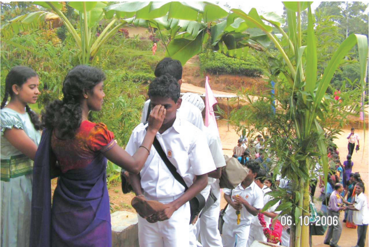
මස්කෙලය බිඳුම්ඵර්වි විද්‍යාලයේ සිසුවියක් විසින් ආරාධිත කු/හිත්ද දෙමළ ම.වී. සිසුවකු වාරතානුකූලව පිලිගනිමින්