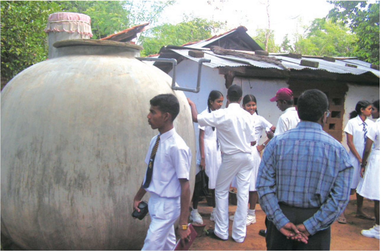
අ/වර්ස්වන්ද ම.වී. පැවති කඳවුරේ ක්ෂේත්‍ර වාර්තාවට සහභාගි වූ සිසු සිසුවියන් පිරිසක් කුකුළුව ප්‍රදේශයේ හිටිසක