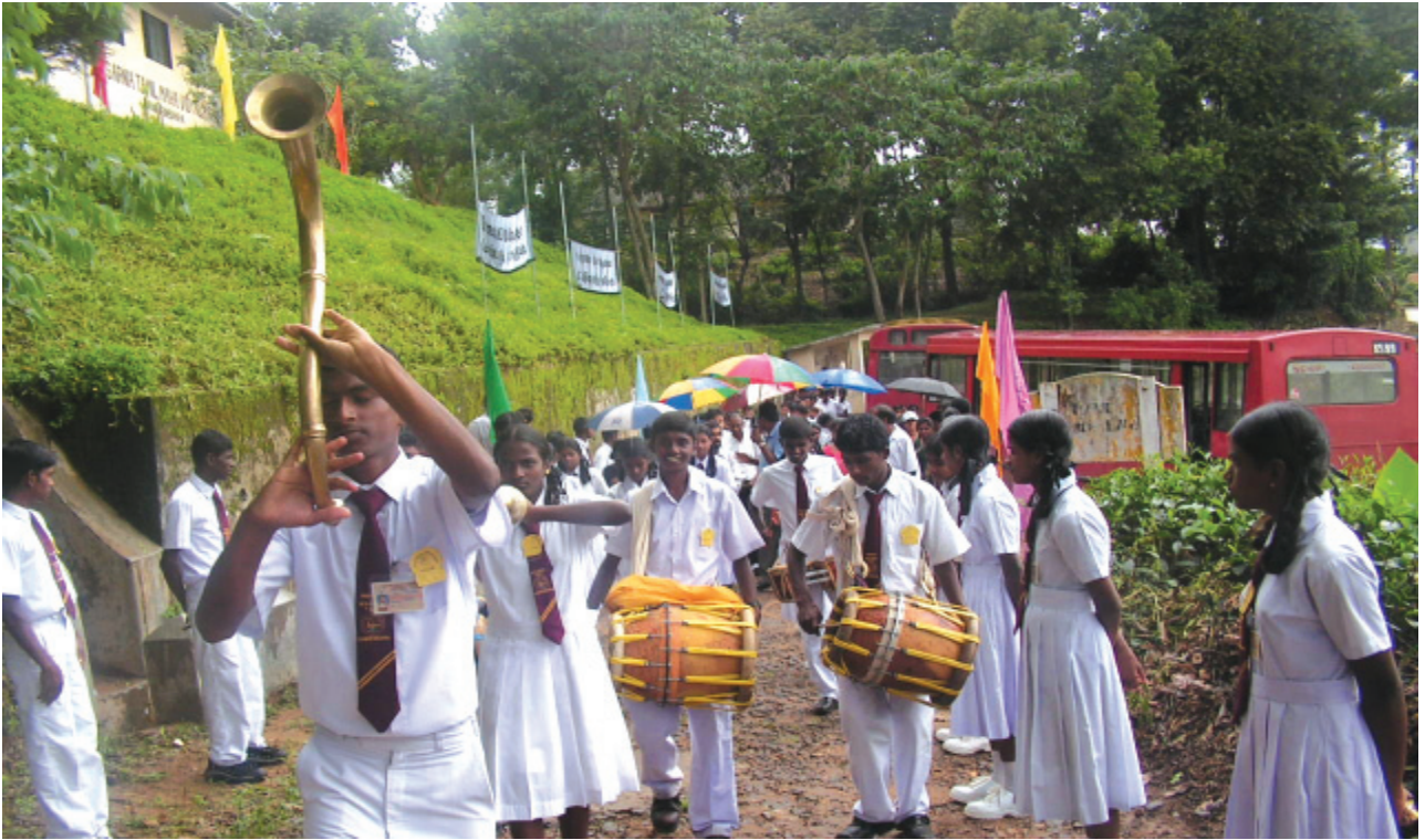
බ/ සාරනියා ම.වී. පැවති කැවුම් සිය පාසලට වාර්තානුකූලව ආරාධිත පාසල් කැඳවාගෙන යන පාසල් තූර්වවාදක කණ්ඩායම