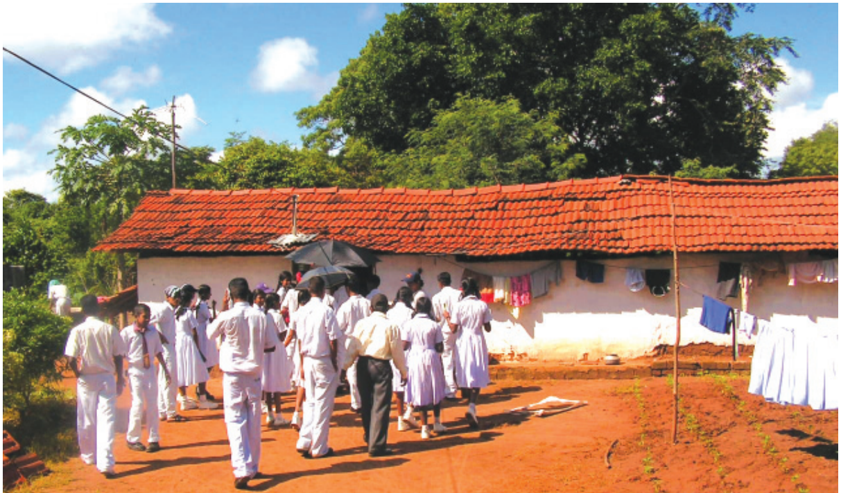
අනුරාධපුරයේ කුකුළුව හැමති ගමේ ක්ෂේත්‍ර වාර්තාවක නැයැලෙන සිසු සිසුවියන් පිරිසක්

ඔබලාට නං බලාපොරොත්තුවක් තියනවා. මේ අයට ඒකත් නෑ. යුද්ධයෙනුත් බැරට කනවා. මේ නිසා, අප අතරේ ඇති වුණු සහෝදර බැඳීම මේ සියලු කටුක අත්දැකීම් මැද්දේ බොහෝ කලක් පවතීවා යන්න මගේ පැතුමයි.