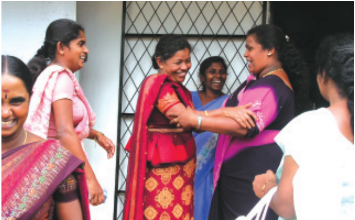
සෞකඩගල පුරවරයෙන් බදුල්ලට පැමිණි ගුරුවරියන් සතුට බෙදාගත්මින්