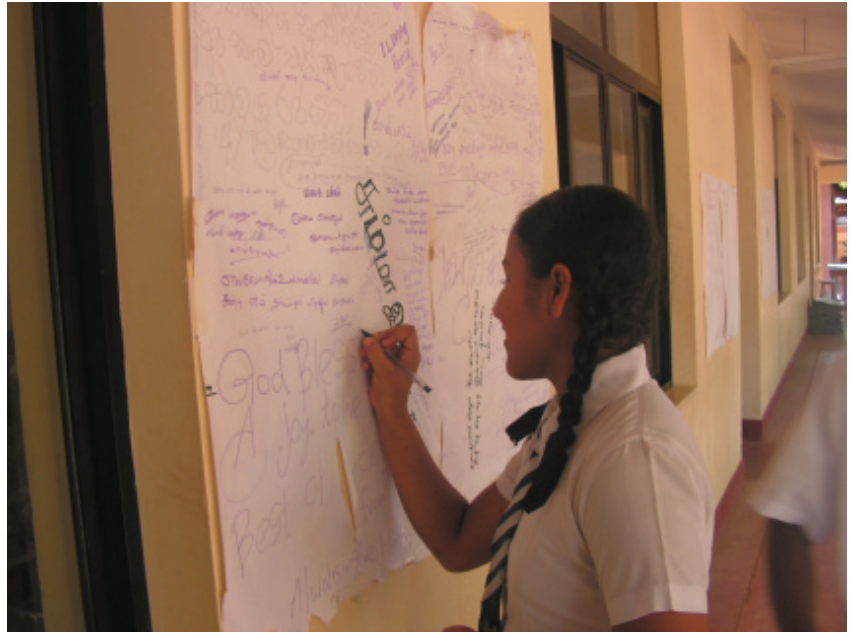
අ/වලසිංහ හර්ශවන්ද්‍ර විදුහලේ දී හරමාණයක් එක් කරමින්

පිපෙන්නට වෙර දරන මල් කැකුළු වන් අපට ජාති හේද රකුසාගෙන් ගැලවීමට ඇති එකම මග සාම මාවතේ පියවරින් පියවර ඉදිරියට යෑමයි හිලුකා මොනරාගල මැදි මහ විදුහල