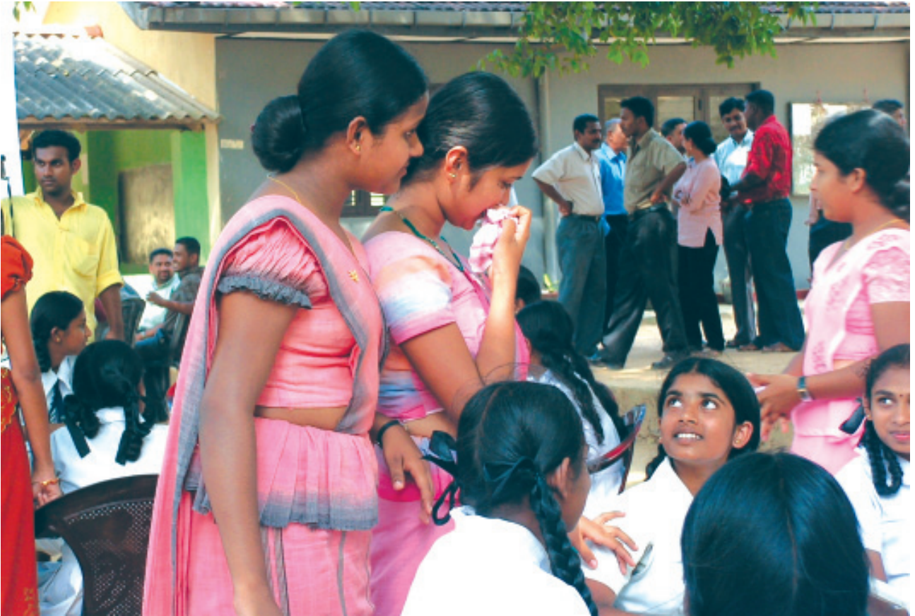
பிழைகடல் கெடகை அழி/கருகிரியகைவ லா பககர் கெ.ம.லி. கிழலியன்