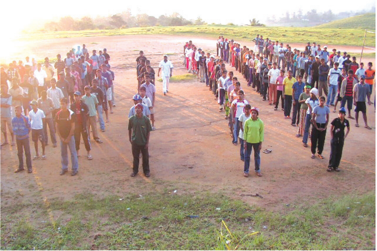
මහ/ කරගස්කඩ ම.වි. කඳවුරේ දවසේ ආරම්භය සහිතවත් කරමින් වකායාමයේ යෙදෙන සිසු සිසුවියන්.