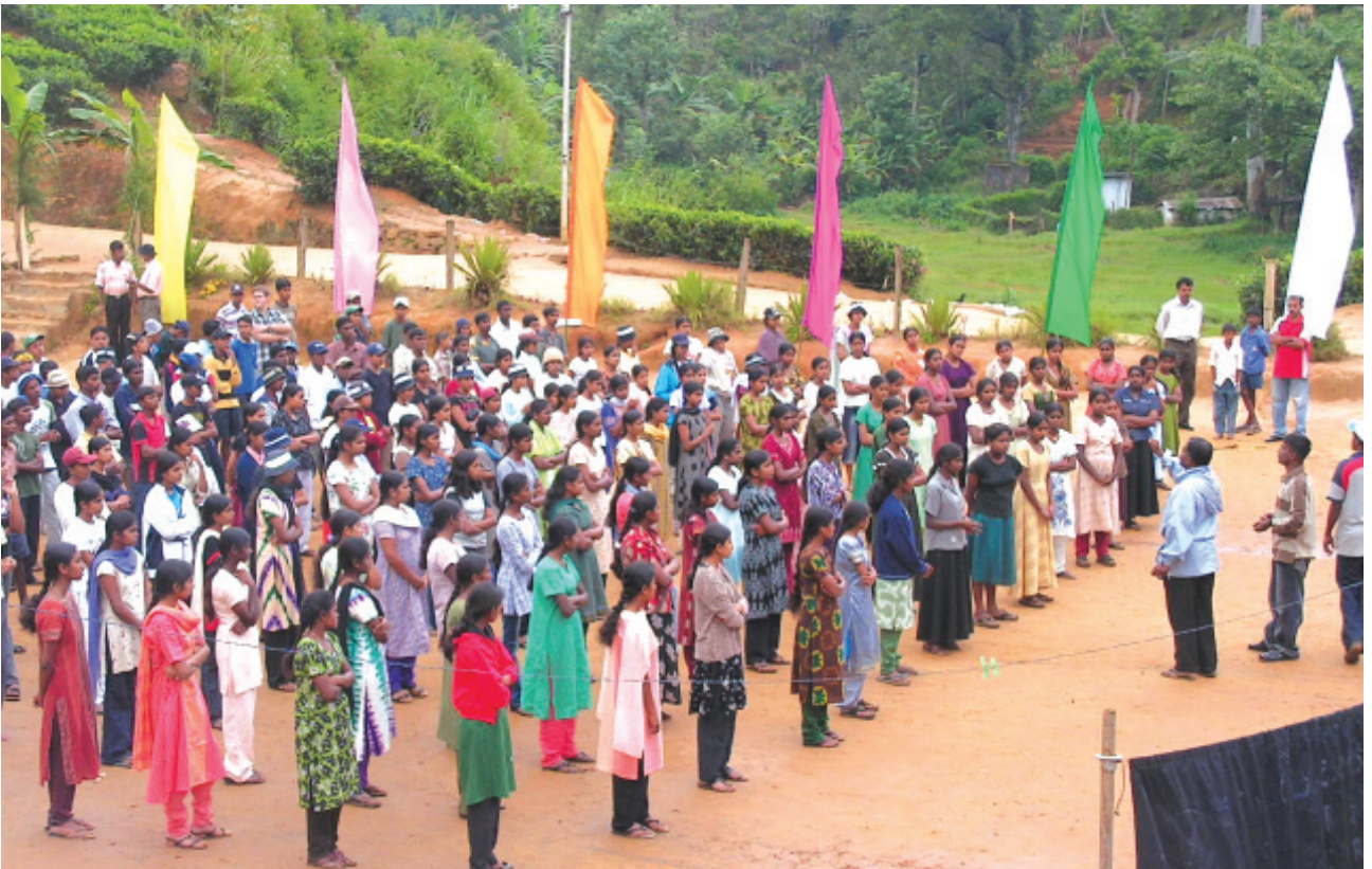
මස්කෙලිය බිඳුම්මිලිඳි විදුහලයේ පැවති කඳවුරේ ක්ෂේත්‍ර වාර්තාව පිටත්වීමට පෙර උපදෙස් ලබමින්