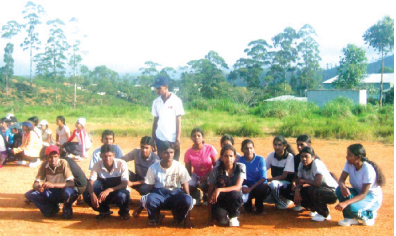
සෑටත් තැඹිලත්ඩි වීඳුතලයේ පැවති කඳවුරේදී ශ්‍රීඩාවේ යෙදීමට සුදානම් වූ සිසු සිසුවියන් පිරිසක්