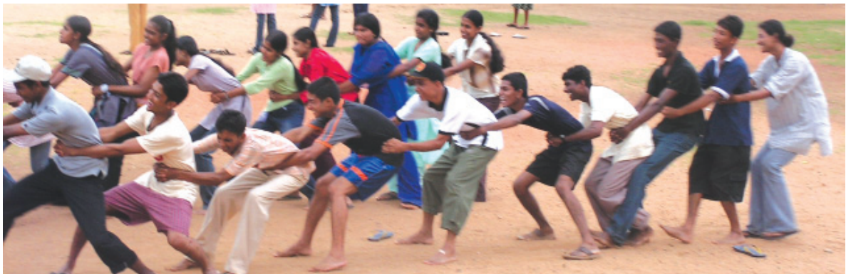
අ/හරිශ්චන්ද්‍ර ම.වි. පැවති කැවුරේ දී ක්‍රීඩාවේ යෙදෙන සිසු සිසුවියන් පිරිසක්