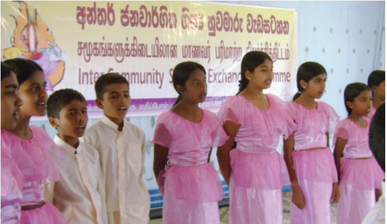
මහ/කරගස්කඩ ම.වී. පැවති කළුවරේ දී පනස් නම වෙනි හිඳහස් සමරු දින සමරමින් වම පාසලේ සිසු සිසුවියන් පිරිසක් පාඨක ගීය ගයනා කරන අයුරු