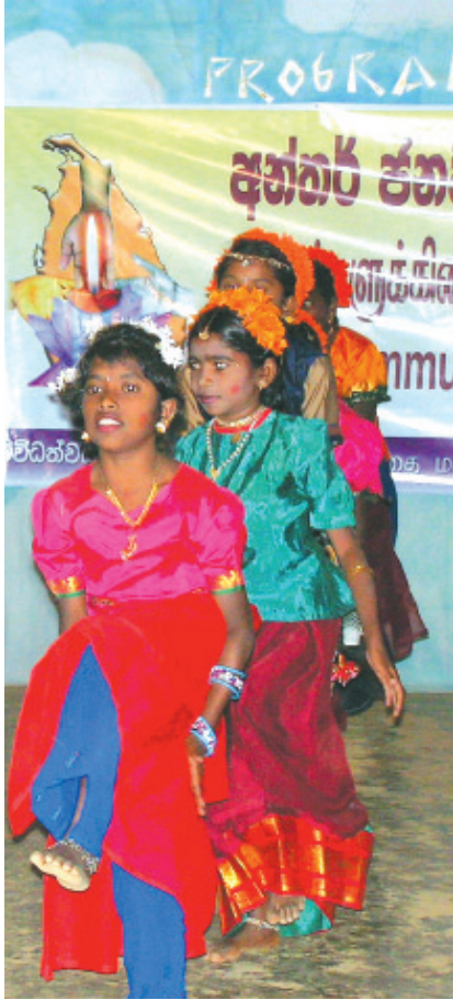
මස්කෙළිය බිලුම්ඟිල්ලි විදුහලේ පැවති සිසු හුවමාරු කඳවුරේ සංස්කෘතික සංදර්ශනය වර්ණවත් කළ බිලුම්ඟිල්ලි විදුහලේ සිසුවියෝ

කඳවුරේ දෙවැනි දිනයෙහි ප්‍රථම අංකය වූයේ ශාරීරික ව්‍යායාම යි. කෞතු වාර්තා එහි දෙවැනි පියවරයි. ක්ෂේත්‍ර වාර්තාවෙන් පසු ව දිවා ආහාරය සඳහා අවස්ථාව ලැබිණ.