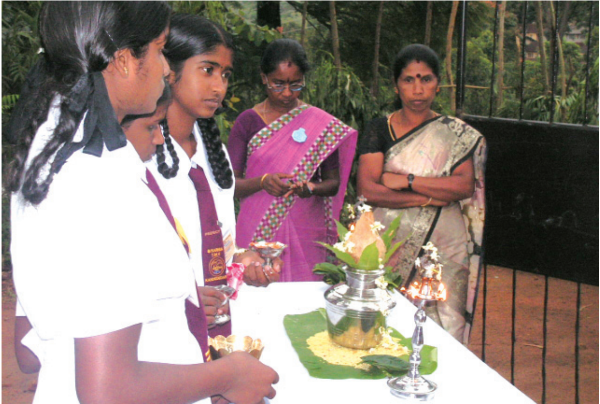
ආරාධිත පාසල් වාර්තානුකූලව පිළිගැනීමට බලා සිටින සාර්නියා විදුහලේ සිසුවියන් හා ගුරුවරියන්