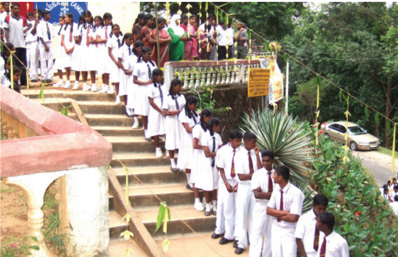
පස්සර දෙමළ ම.වී. පැවති කඳවුරේ ආරාධිත පාසල් පිළිගැනීමට මඟ බලා සිටින පස්සර සහ ලුණුගල දෙ.ම.වී. සිසු සිසුවියන් හා ගුරුවරුන්