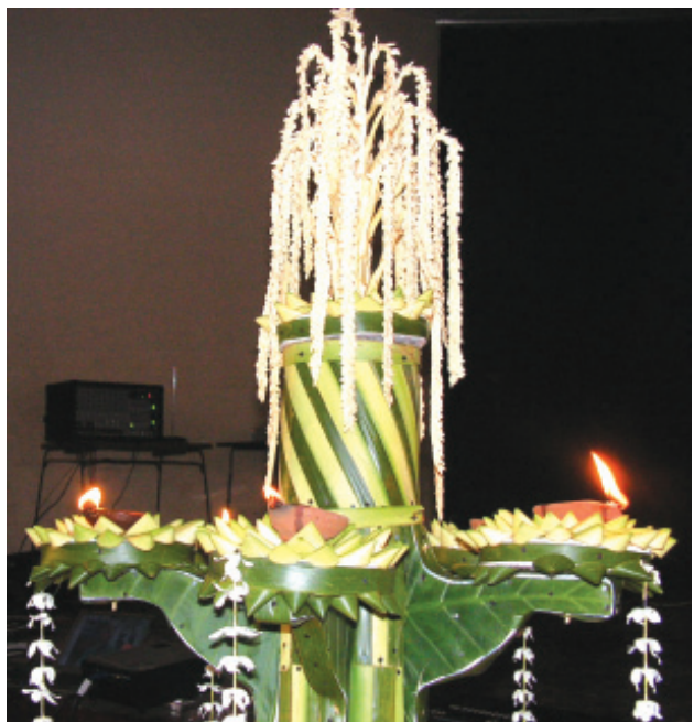
විකල්ප ප්‍රතිපත්ති කේන්ද්‍රය

තෙදින කඳවුරේ අවසාන අදියර වළඹිණ. කෙටි අනුශාසනා කිහිපයකින් අනතුරුව සිංහල හා දෙමළ භාෂා දෙකින් ම ජාතික ගීය ගයනු ලැබිණ. කඳවුරේ වැඩ කටයුතු අවසන් විය.