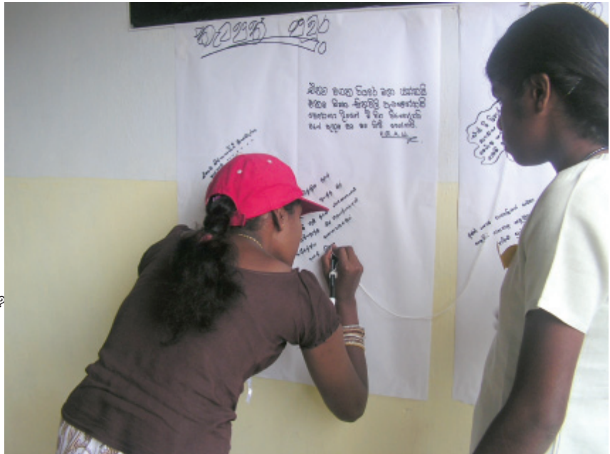
කැටපත් පවුරට අදහස් ගොනු කරන සිසුවියක්

යුද්ධය නිසා දම්ල සොයුරු සොයුරියන්ගේ ජීවිත අහිමි වී නම් සිහල සොයුරු සොයුරියන්ගේ ජීවිත අහිමි වේ නම් එය ඔවුන්ගේ ජයග්‍රහණයක් ද නැත... මිය යන්නේ ශ්‍රී ලාංකීය සොයුරු සොයුරියන් නොවේද? එසේ නම් අප සියලු දෙන පරාජිතයන් නොවේ ද?