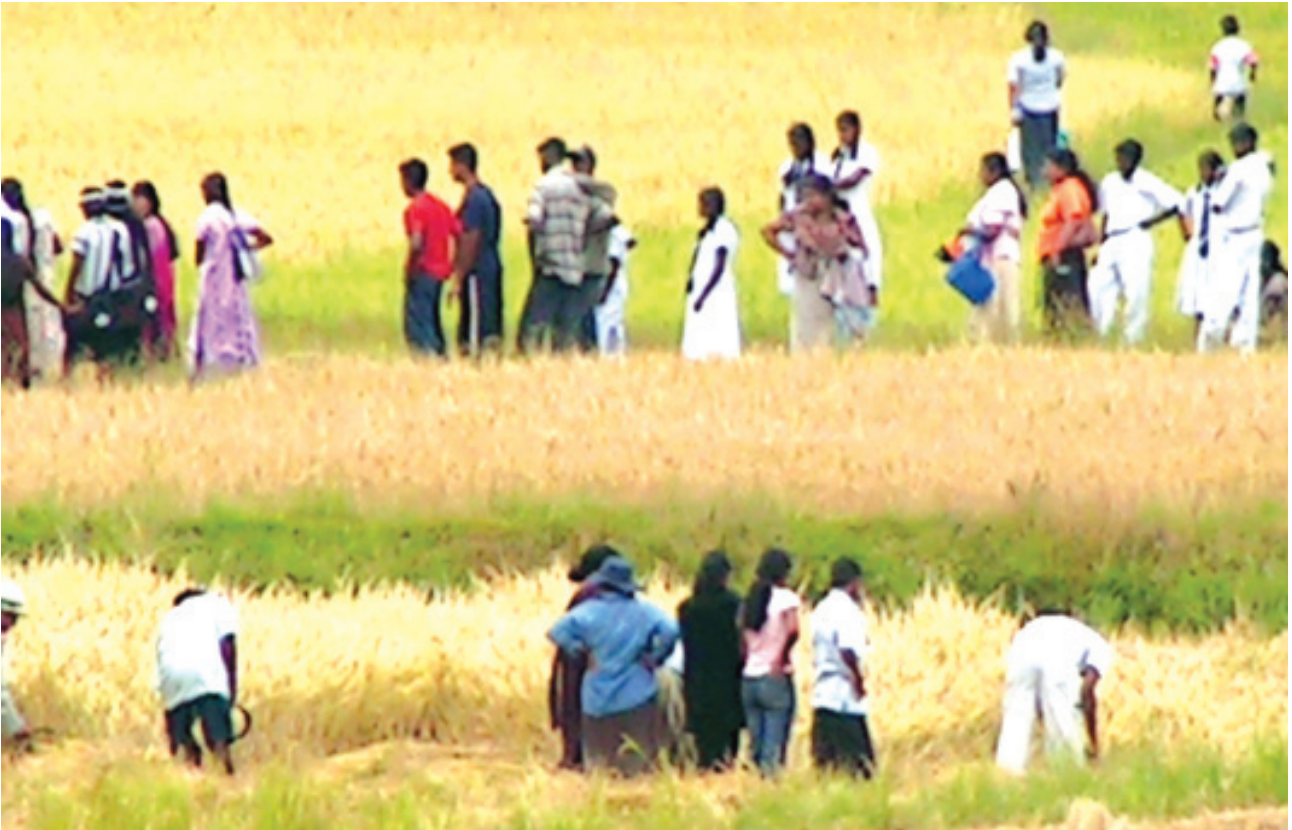
කු/හින්දු දෙමළ ම.වී. කඳවුරේ ක්ෂේත්‍ර වාර්තාව අතරතුර ගොයම් කැපීමේ අත්දැකීම බෙදා හදාගන්නා සිසු සිසුවියන් පිරිසක්