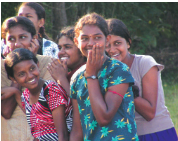
අම්/ගලහිටියාගොඩ ම.වි. පැවති කඳවරේ සිසුවියන් පිරිසක් ක්‍රීඩා පිටියේ විනෝද වූ අවස්ථාවක්