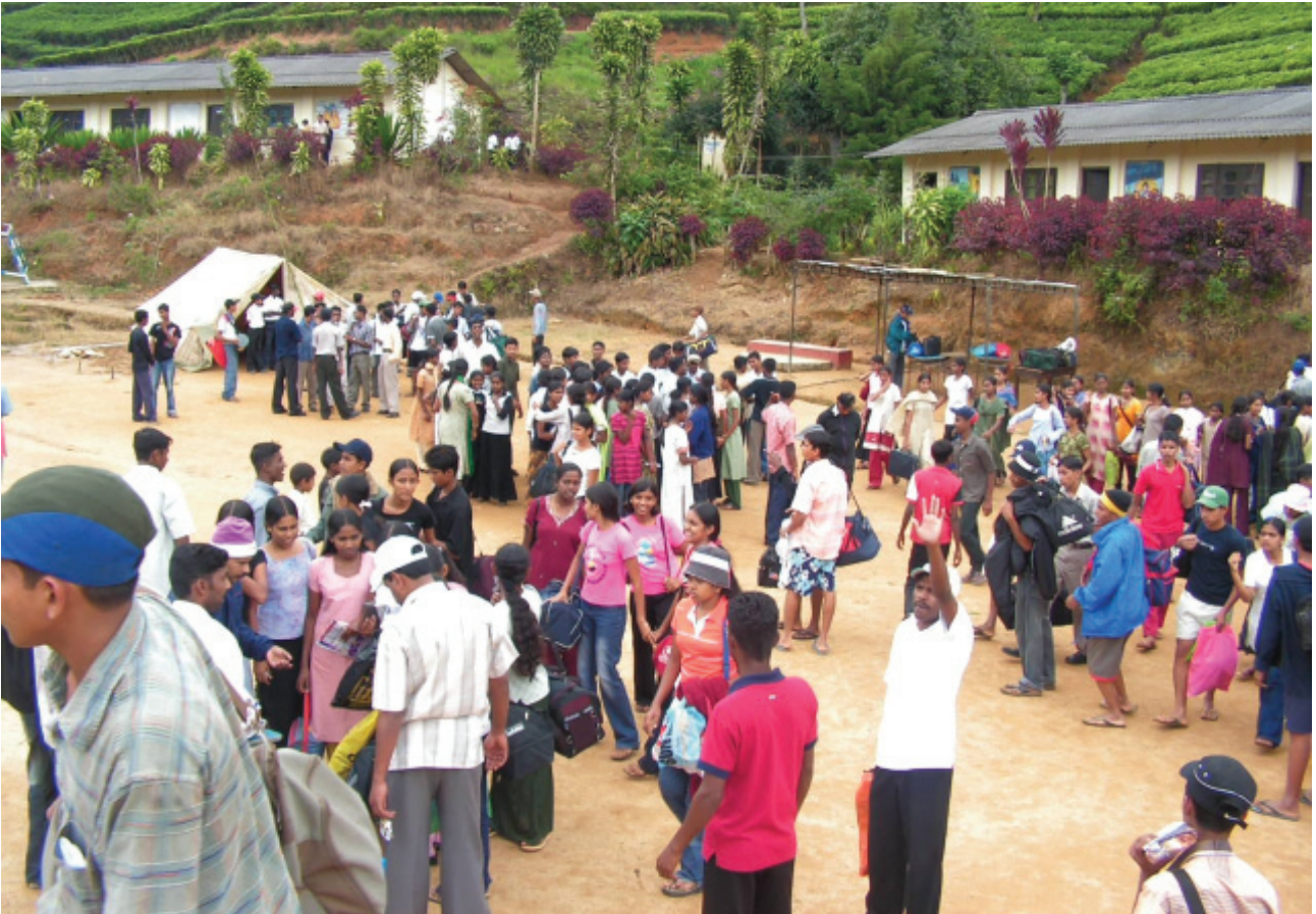
අතැල්පුරයේ පාසල්වලින් පැමිණි සිසු සිසුවියන්, බ්‍රිගේඩ් විද්‍යාලයේ සහෝදර සහෝදරියන්ට සමු දෙමින්...