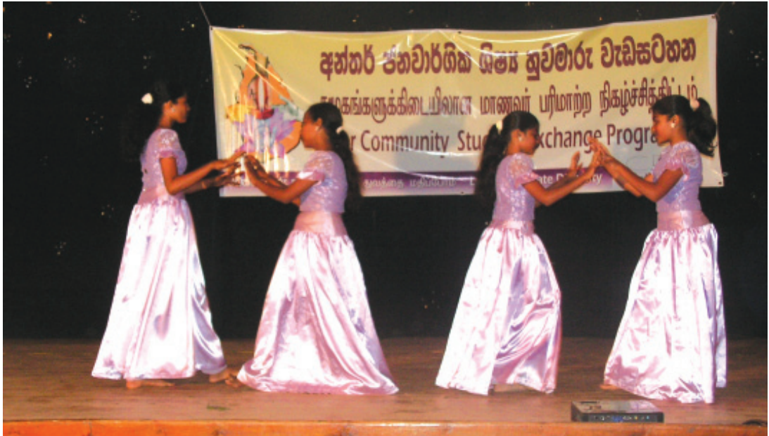
අනු / සහිරා විද්‍යාලයේ පැවති කඳවුරේ සංස්කෘතික සංදර්ශනය වර්තමාන කරන සිසුවියන් පිරිසක්