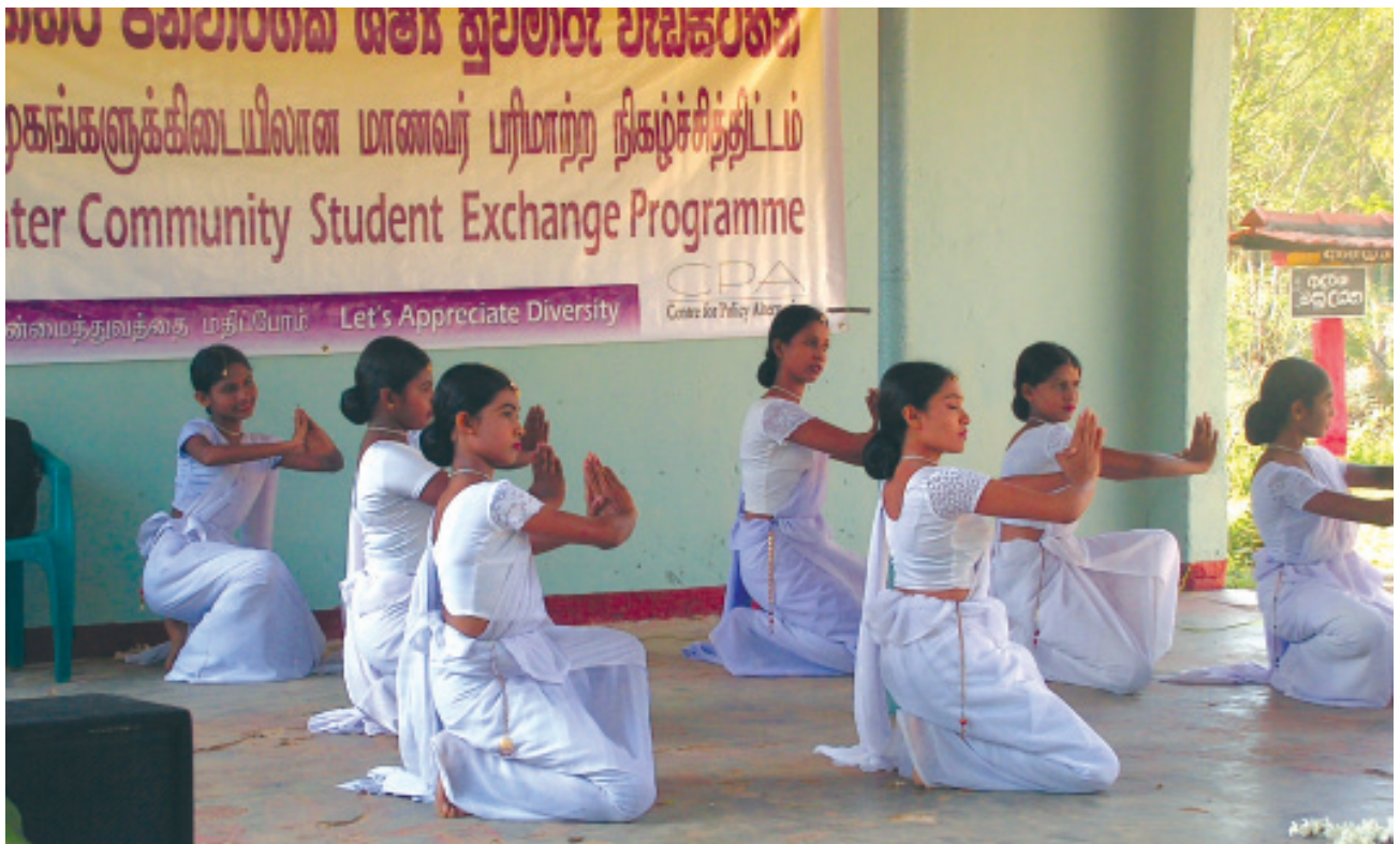
லர்நககைன் கககககைன் பிழைகடல் அழி/கருகிரியகைவ ம.லி. கிழலியன்