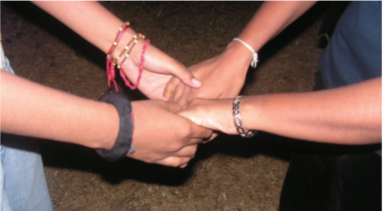
අත්වැල් බැඳගත් මනුෂ්‍යත්වය