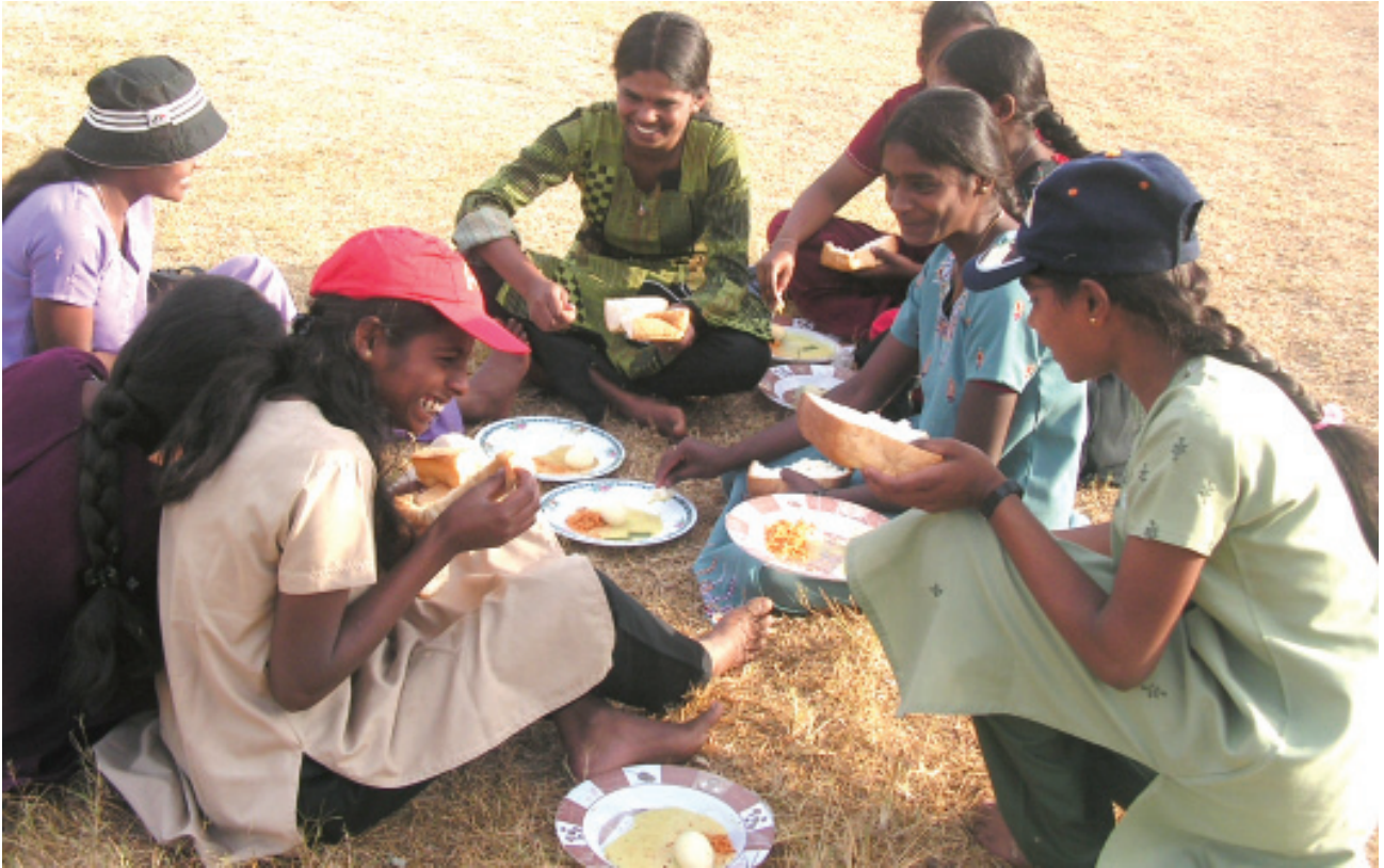
කු/හින්දු දෙමළ ම.වි. පැවති කඳවුරේ ක්‍රීඩා පිටියට වී ආහාර ගන්නා පස්සර දෙමළ ම.වි. සිසුවියන් පිරිසක්