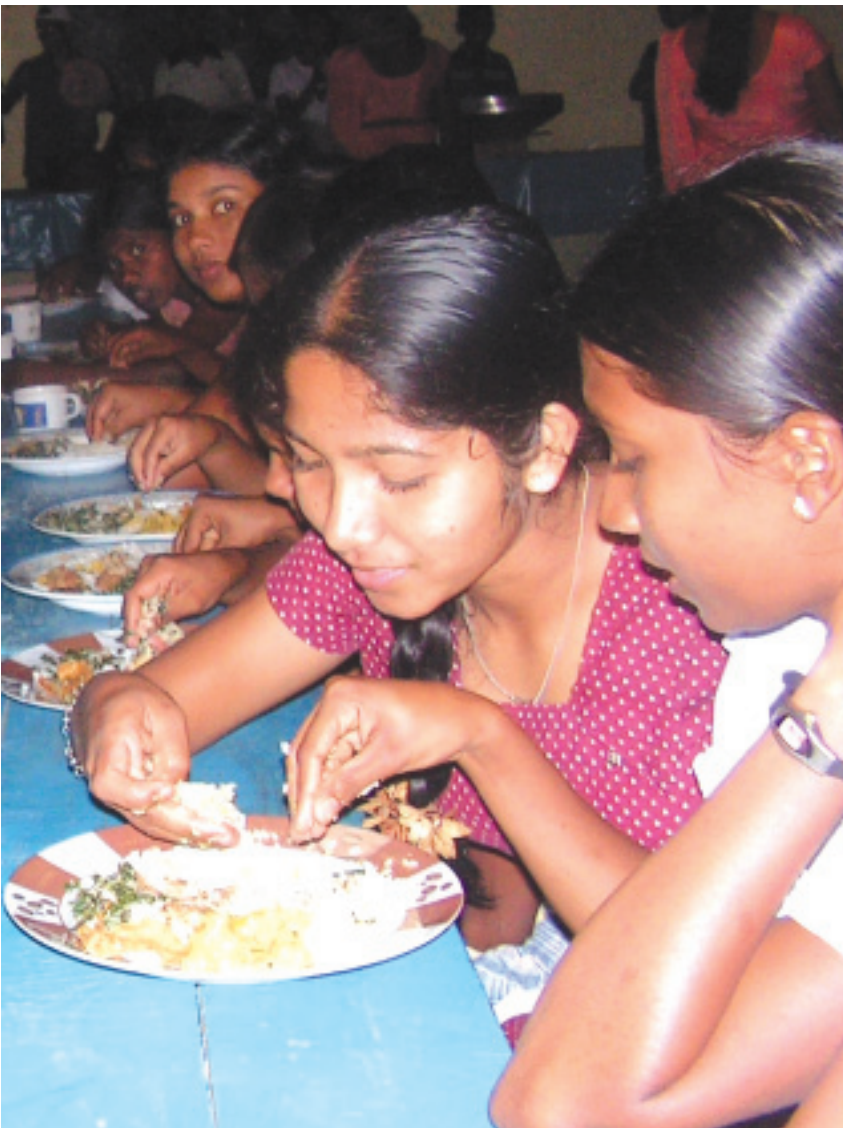
අම්/ගලහිටියාගොඩ පාසලේ පැවති කඳවුරේ රාත්‍රී කෂම වේල සහෝදරත්වයෙන් යුතුව බෙදාගන්නා සිසුවියන් දෙදෙනෙක්